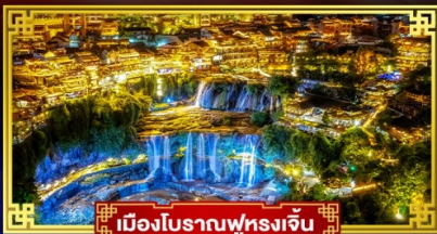
เมืองโบราณฟุรงเจิน

เที่ยง 2 เมืองโบราณ ตระกูลเมืองนิมโ "ICE & SNOW WORLD"