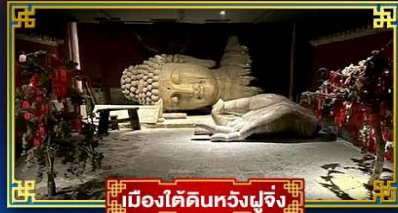
เมืองไคผิงหวงฟูจิง

“กำแพงหิมะ”...สิ่งมหัศจรรย์ของโลก พระราชวังต้องห้าม อดีตพระราชวังหลวงสุดยิ่งใหญ่