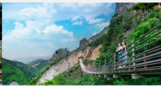
หุบเขารอยแยกอุ๋หลิงซาน