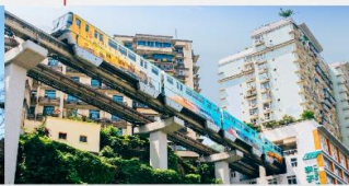
รถไฟฟ้าทะลุติ๊ก

*ทางบริษัทฯ ขอสงวนสิทธิ์ในการสลับโปรแกรมทัวร์ตามความเหมาะสมขึ้นอยู่กับสถานการณ์หน้างาน โดยคำนึงถึงผลประโยชน์ของลูกค้าเป็นสำคัญ