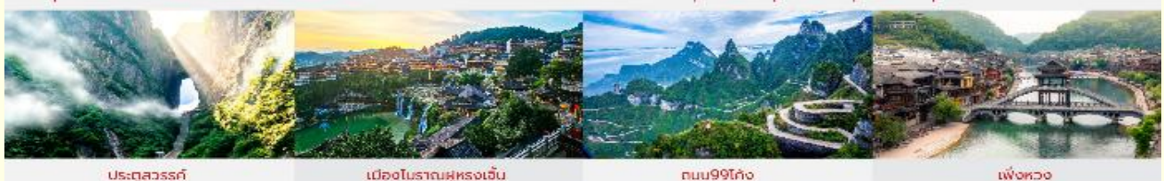
ประตูสวรรค์ เมืองโบราณฝูหรงเจิน ถนน99โค้ง เพ็งหวง