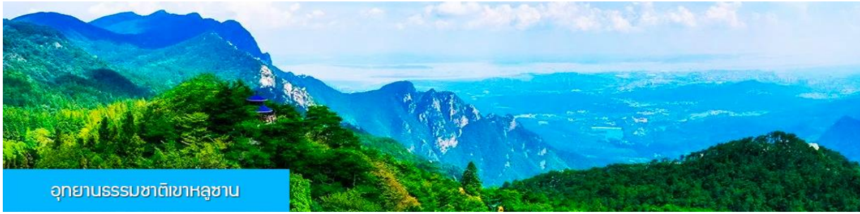
อุทยานธรรมชาติเขาหลูซาน