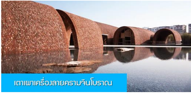
เตาเผาเครื่องลายครามจินโบราณ