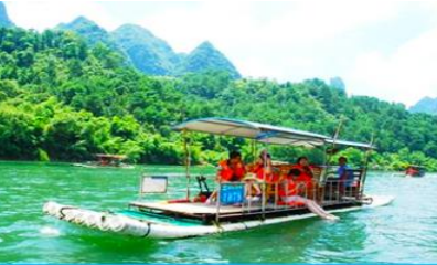
ล่องแพไม้ไผ่