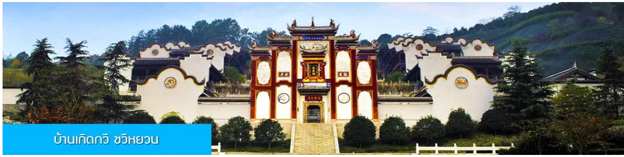
บ้านเกิดกวี ชวีหยวน