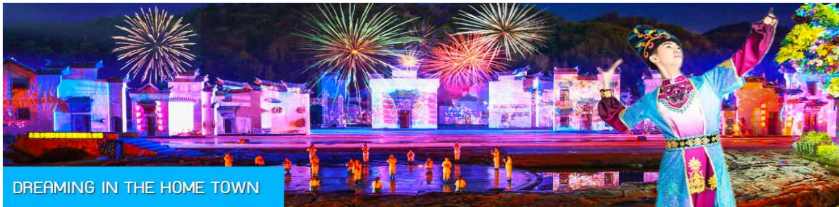
DREAMING IN THE HOME TOWN

หลังอาหารนำท่านเดินทางเข้าที่พัก หรือท่านสามารถเลือกซื้อโปรแกรมเสริม เป็นบัตรชมการแสดง ชุด DREAMING IN THE HOME TOWN เป็นการแสดงบนเวทีขนาดใหญ่ที่จัดสร้างขึ้นกลางแจ้ง ท่ามกลางธรรมชาติที่มีภูเขาเป็นฉากหลัง ใช้ทุนสร้างกว่า 280 ล้านบาท เป็นการแสดงที่น่าดูชมที่สุดในมณฑลเจียงซี แต่ละครจากการแสดงมีการออกแบบเวที ฉากประกอบที่พิถีพิถัน ประณีต และอลังการ ใช้ทีมงานนักแสดงหลายร้อยคน และระบบแสง สี เสียงที่ทันสมัยประกอบในการแสดง