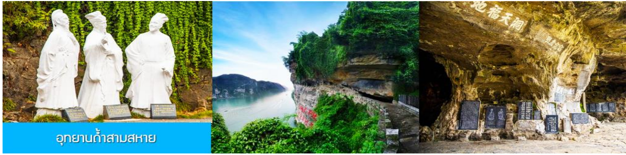
อุทยานถ้ำสามสหาย