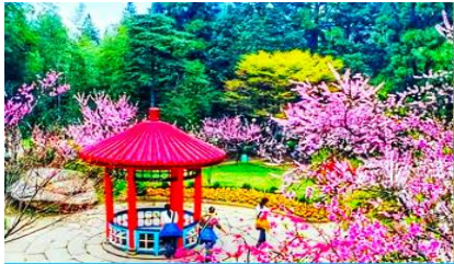
สวนฮวาจิ้ง