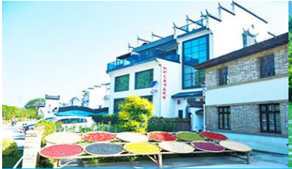
หมู่บ้านโบราณ ลือเหมินซุน