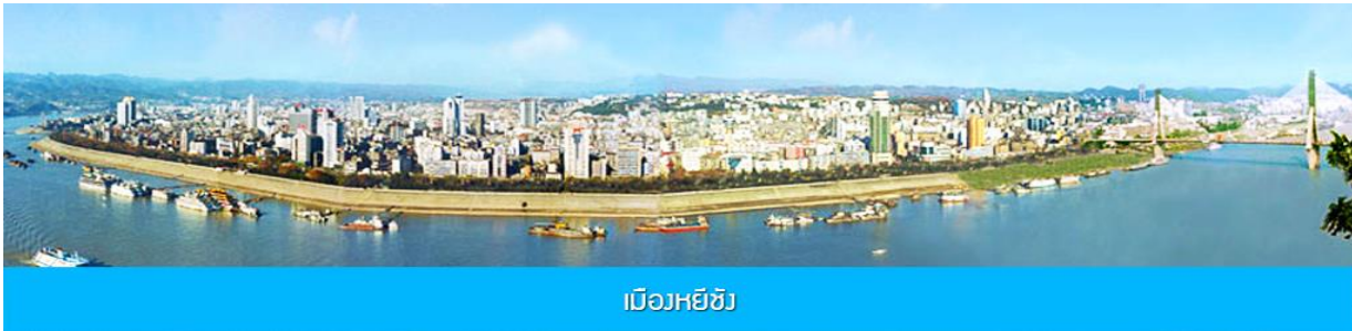
เมืองหยี่ชาง