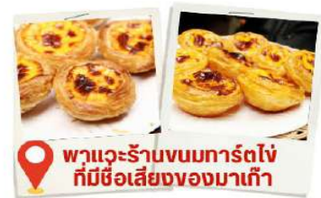
พาแวะร้านขนมทาร์ตไข่ ที่มีชื่อเสียงของมาเก๊า

สถานที่นี้โดดเด่นไปด้วยสถาปัตยกรรมตะวันตก ตกแต่งด้วยเสาแบบโรมันและรูปปั้นนักบุญสำคัญของศาสนาคริสต์ แต่เดิมเป็นโบสถ์ที่ใหญ่ที่สุดในมาเก๊า สร้างขึ้นตั้งแต่ปี ค.ศ. 1602-1637 เพื่อเป็นศูนย์รวมแรงศรัทธาของชาวคริสต์ แต่แล้วก็เกิดเหตุไฟไหม้จากห้องครัวของโบสถ์เมื่อปี ค.ศ. 1835 ลุกลามไปทั่วจนทำให้ตัวโบสถ์พังทลายเหลือเพียงส่วนหน้าประตูที่ยังไม่ถูกทำลาย จนกระทั่งปี ค.ศ. 1991 ที่มีการบูรณะซากประตูโบสถ์อีกครั้ง ทำให้ที่นี่กลายเป็นหนึ่งในสถานที่ท่องเที่ยวที่มีความสำคัญต่อประวัติศาสตร์มาเก๊า และได้รับการยกย่องให้เป็นมรดกโลก