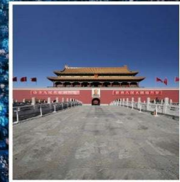
จัตุรัส เทียนอันเหมิน