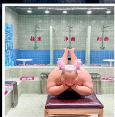
คาเฟ่ย้อนยุคเหอผิง