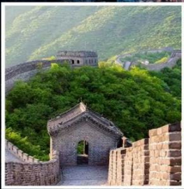
กำแพงเมืองจีน มู่เถียนยวี่