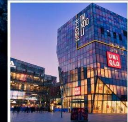
ย่านชานหลี่กุน