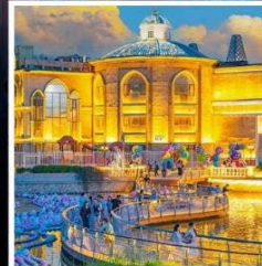
ห้าง SOLANA CENTER