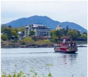
ล่องเรืออปปะระะ