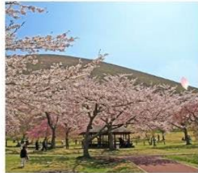
ซากุระ โนะ ซาโตะ