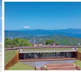
มิโระ คาเฟ่321