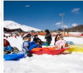
ลานสกีเยติ