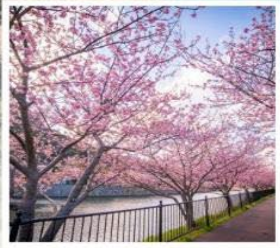
เทศกาลคาวาซุ ซากุระ