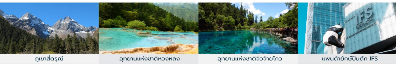
*ทางบริษัทฯ ขอสงวนสิทธิ์ในการสลับโปรแกรมทัวร์ตามความเหมาะสมขึ้นอยู่กับสถานการณ์หน้างาน โดยคำนึงถึงผลประโยชน์ของลูกค้าเป็นหลัก