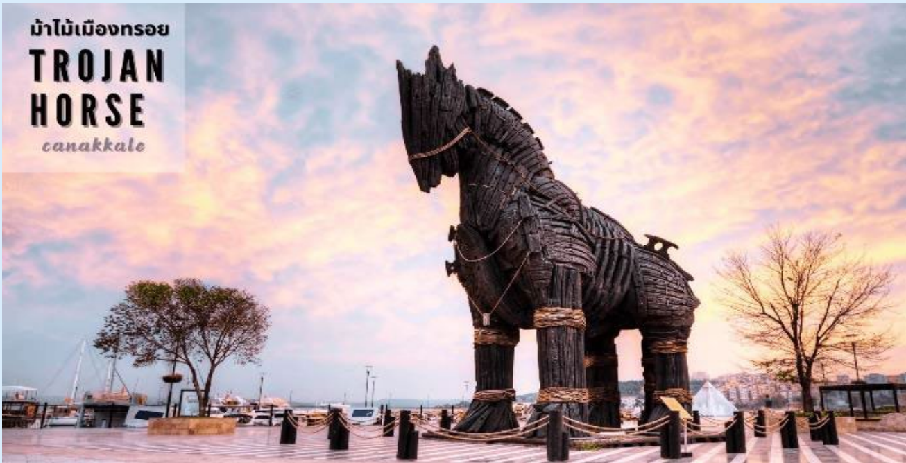
ม้าไม้เมืองทรอย TROJAN HORSE canakkale

มอม่่าไม้จำลองเป็นของขวัญ จึงเซ็นเข้าไปไว้ในเมือง ตกกลางคืนชาวทรอยนอนหลับหมด ทหารที่ซ่อนอยู่ในม้าก็ออกมาเปิดประตูให้กองทัพกรีกเข้ามาทำการยึด และเผากรุงทรอยจนย่อยยับ ซึ่งม้าไม้จำลองแห่งเมืองทรอยที่เห็นอยู่ในเมืองชานัคคาเล่ นี้ได้รับมาจากกองถ่ายทำละคร วอเนอร์ บราเธอร์ ใช้ถ่ายทำละคร เรื่องทรอย เมื่อถ่ายทำเสร็จแล้วจึงยกให้เป็นสมบัติของที่นี้ตั้งแต่ปี 2004 อิสระเก็บภาพประทับใจตามอัธยาศัย จนถึงเวลานัดหมาย