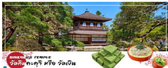
GINKAKUJI TEMPLE วัดกินคะคุจิ หรือ วัดเงิน

จากนั้นนำท่านสู่ วัดกินคะคุจิ (Ginkakuji Temple) หรือ วัดเงิน (ใช้ระยะเวลาในการเดินทางประมาณ 15 นาที) เป็นอีกหนึ่งในสถานที่ที่ขึ้นทะเบียนกับองค์การยูเนสโกให้เป็นมรดกโลกด้านวัฒนธรรม ซึ่งวัดกินคะคุจิเป็นวัดนิกายเซน ถูกสร้างขึ้นโดยโชกุนอชิคากะ โยชิมาสะ หลานชายของท่านโชกุน ที่สร้างวัดกินคะคุจิ (Kinkakuji Temple) หรือที่รู้จักกันอย่างกว้างขวางว่าวัดทองสำหรับอาคารของวัดเงินสร้างขึ้นในรูปแบบเดียวกัน เพียงแต่จะไม่ได้มีสีทอง เป็นอาคาร 2 ชั้น และมีกฟืนกชอยู่บนหลังคา