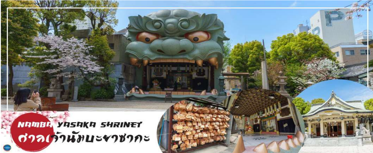
NAMBA YASAKA SHRINE ศาลเจ้านัมมะยาซากะ

เมืองโอซาก้า – ศาลเจ้านัมมะยาซากะ – ตลาดคุโรมง – Mitsui Shopping Park LaLaport Sakai – ห้างอิออน มอลล์ ริงกุเซนนัน – ท่าอากาศยานนานาชาติคันไซ – ท่าอากาศยานนานาชาติดอนเมือง