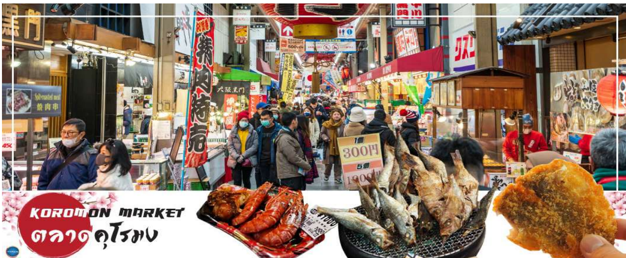
KUROMON MARKET ตลาดคุโรมง

จากนั้นนำท่านเดินทางสู่ ตลาดคุโรมง โอซาก้า (Kuromon Ichiba Market) เป็นตลาดที่มีชื่อเสียงและเก่าแก่มากที่สุดแห่งหนึ่งของเมืองโอซาก้า บรรยากาศภายในเป็นทางเดิน Arcade เล็กๆ ทอดยาวประมาณ 600 เมตร 2 ข้างทางจะเต็มไปด้วยร้านค้าต่างๆกว่า 160 ร้านค้าขายทั้งของสด และแบบพร้อมทาน มีของกินเล่นและอาหารพื้นเมืองมากมายหลายชนิดให้ได้ชิมกัน