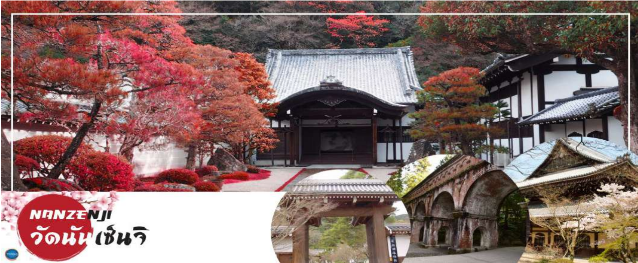
NANZENJI วัดนันเซ็นจิ

วันที่สาม เมืองโอซาก้า – เมืองเกียวโต – วัดนันเซ็นจิ – การเรียนพิธีชงชาญี่ปุ่น – วัดกินคะคุจิ หรือ วัดเงิน – ถนนสายนักปราชญ์ – เมืองโอซาก้า – ซัปโปงชินไซบาชิ