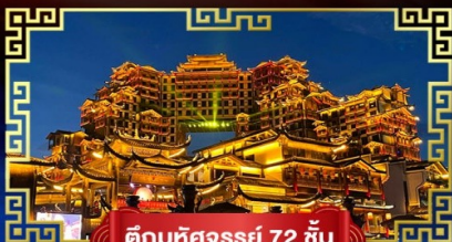
ตึกมหัศจรรย์ 72 ชั้น