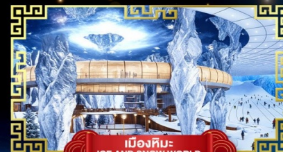
เมืองหิมะ ICE AND SNOW WORLD