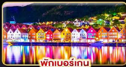
พิกเบอร์เกน