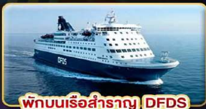
พิกบนเรือสำราญ DFDS