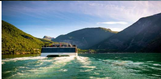
ล่องเรือชมความสวยงามของ “ซอจันฟยอร์ด” จาก เมืองฟลัม สู่ หมู่บ้านกูดวาเกิน (Sogne Fjord Cruise from Flam to Gudvangen)