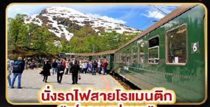
นั่งรถไฟสายโรแมนติก “ฟรอมสปาน่า”