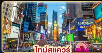
ไทม์สแควร์