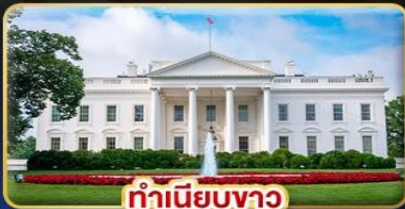
ทำเนียบขาว