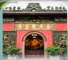
วัดโบราณต้าฉือ

คอนเฟิร์มออกเดินทาง ทุกพีเรียด 2 ท่านขึ้นไป