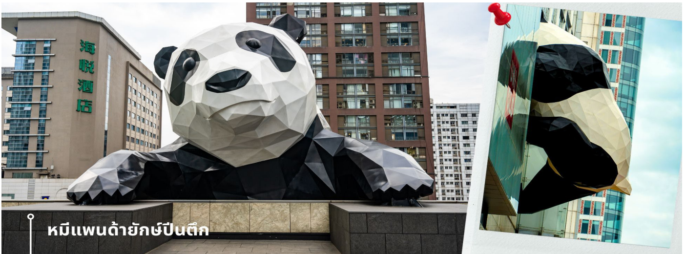
หมีแพนด้ายักษ์ป็นติก

จากนั้นนำท่านชมความน่ารัก อันเป็นเอกลักษณ์ของมหานครเฉิงตู นั่นคือ หมีแพนด้ายักษ์ป็นติก ประติมากรรมที่ชื่อว่า "I Am Here" ซึ่งเป็นหมีแพนด้ายักษ์ที่ตั้งอยู่ที่ IFS (International Finance Square) ในเมืองเฉิงตู ประติมากรรมนี้มี