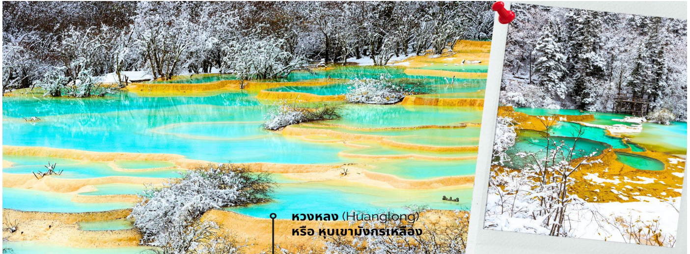
หวงหลง (Huanglong) หรือ หุบเขามังกรเหลือง

หวงหลง (Huanglong) หรือ หุบเขามังกรเหลือง (รวมค่ากระเช้าขึ้น-ลง หวงหลงและรถแบตเตอรี่) ที่ได้รับการขึ้นทะเบียนเป็นมรดกโลก รายล้อมไปด้วยอ่างน้ำสีฟ้าจำนวนมากไม่ถ้วน และภูเขาสูงใหญ่สลับซับซ้อน อุทยานหวงหลง (Huanglong Scenic and Historic Interest Area) หรือ หุบเขามังกรเหลือง แหล่งธรรมชาติที่อุดมสมบูรณ์บนเทือกเขา Minshan Mountains มีระบบนิเวศที่หลากหลาย ทั้งน้ำพุร้อน น้ำตก แอ่งน้ำหินปูน รวมถึงเป็นแหล่งของพืชพรรณนานาชนิด และสัตว์ป่าใกล้สูญพันธุ์อย่าง แพนด้ายักษ์ และ ลิงจมูกเชิดสีทอง เป็นต้น ที่สำคัญยังมีทัศนียภาพที่สวยงามทั้งราวกับเป็นดินแดนสวรรค์ ด้วยคุณสมบัติเหล่านี้ อุทยานหวงหลงจึงได้รับการขึ้นทะเบียนเป็นมรดกโลกโดย