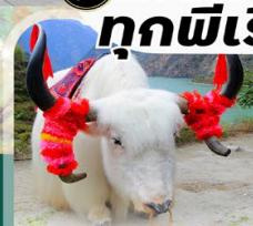
ทะเลสาบเต๋อซี