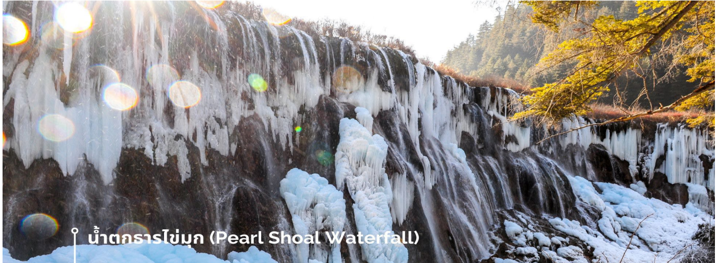
น้ำตกธารไข่มุก (Pearl Shoal Waterfall)

หรือ น้ำตกนุริออลาง (Nuo Ri Lang Waterfall) ถือเป็นน้ำตกที่ใหญ่ที่สุดในจังหวัดจิวจ้ายโกว มีความสูง 40 เมตร กว้าง 310