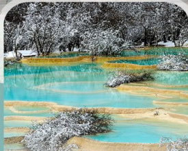
อุทยานแห่งชาติหวงหลง (บริการรถเช่าขึ้นลง+รถใบเตย)