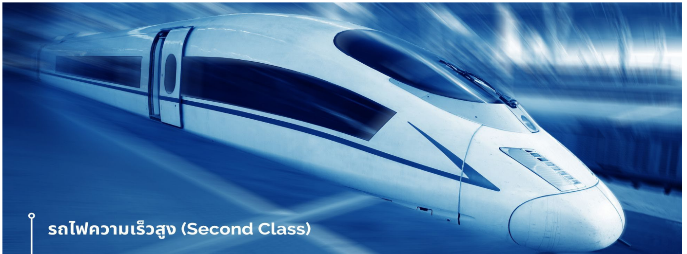
รถไฟความเร็วสูง (Second Class)

นำท่านเดินทางสู่สถานีรถไฟ เพื่อเดินทางด้วย รถไฟความเร็วสูง (Second Class)