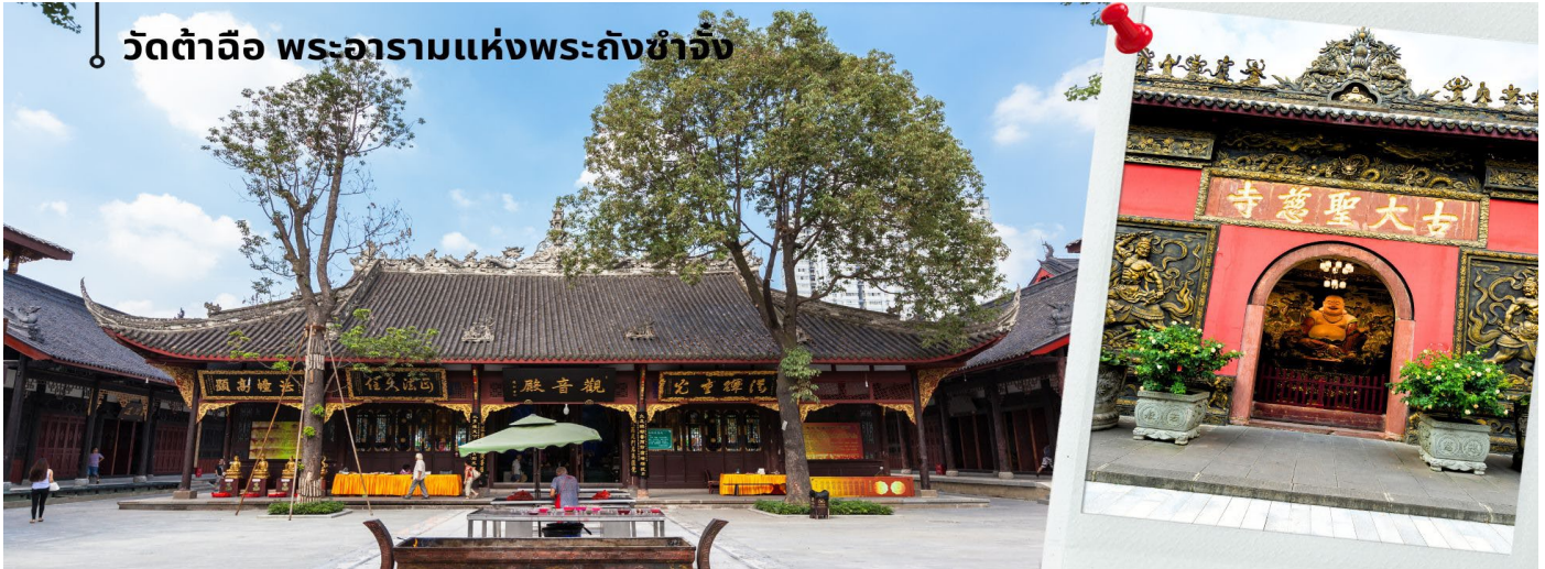
วัดต้าฉือ พระอารามแห่งพระถังซำจั๋ง

นำท่านชม วัดต้าฉือ พระอารามแห่งพระถังซำจั๋ง ใจกลางนครเฉิงตู พระถังซำจั๋ง ได้รับการสรรเสริญว่าเป็นผู้มีความเพียร และมีชื่อเสียงมายาวนานกว่า 1,400 ปี และยังได้รับการยกย่องว่าเป็น พระไตรปิฎกแห่งราชวงศ์ถัง พุทธประวัติของพระถังซำจั๋งถูกจารึกในสถานที่ต่างๆมากมาย รวมไปถึงได้ถูกกล่าวถึงในจดหมายเหตุหลายเล่ม ตามเส้นทางการเดินทางแห่งความเพียรของท่าน รวมทั้งมีพระอัฐิของท่าน ประดิษฐานอยู่ในพระอารามของนครนานจิง และที่ทะเลสาบ