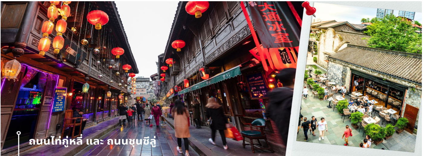
ถนนไท่กุ่หลี่ และ ถนนซุบซีลู่