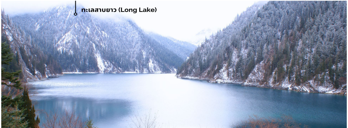
ทะเลสาบยาว (Long Lake)

ทะเลสาบที่ใหญ่ที่สุด สูงที่สุด และลึกที่สุดในจังหวัดจิวจ้ายโกว ด้วยเนื้อที่กว่า 581 ไร่ ความยาวกว่า 7 กิโลเมตร และลึกถึง 103 เมตร ทอดตัวโค้งเป็นรูปพระจันทร์เสี้ยว เนื่องจากหิมะบนภูเขาละลายลงมา น้ำในทะเลสาบสีฟ้าสวยงาม ล้อมรอบด้วยยอดเขาสูงชัน และต้นไม้ขนาดใหญ่ที่ปกคลุมด้วยหิมะ งดงามราวหลุดออกมาจากภาพวาด ความพิเศษในช่วงฤดูหนาว ทะเลสาบจะกลายเป็นน้ำแข็งหนากว่า 60 เซนติเมตร ทำให้นักท่องเที่ยวนิยมมาเล่นสเก็ตน้ำแข็งกันเป็นจำนวนมาก