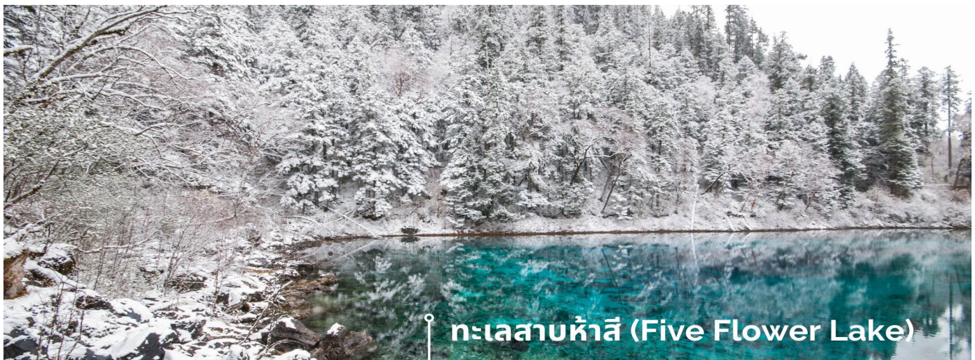
ทะเลสาบห้าสี (Five Flower Lake)

หนึ่งในจุดที่สวยงามและนักท่องเที่ยวแวะมาเยี่ยมชมเยอะที่สุด ตั้งอยู่ที่ความสูงเหนือระดับน้ำทะเลประมาณ 2,472 เมตร น้ำลึกประมาณ 5 เมตร น้ำใสจนเห็นพื้นด้านล่างของทะเลสาบ สีของผิวน้ำสวยงามแปลกตา โดยเฉพาะเมื่อยามแสงอาทิตย์สาดส่องกระทบผิวน้ำ สีของน้ำในทะเลสาบจะสะท้อนเป็นสีส้มถึง 5 เฉดสี สวยงามสะกดตา ซึ่งสาเหตุที่ทำให้เกิดสีส้มต่างๆ นั้นมาจากการสะสมของแร่ธาตุ และพืชน้ำชนิดต่างๆ โดยจะมีสีส้มแตกต่างกันไปตามฤดูกาลและ