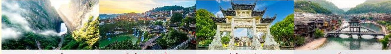
ประตูสวรรค์ เมืองโบราณฝูหรงเจิน วัดโบราณเซียนหมิง เฟิ่งหวง

*ทางบริษัทฯ ขอสงวนสิทธิ์ในการสลับโปรแกรมทัวร์ตามความเหมาะสมขึ้นอยู่กับสถานการณ์บริษัทฯ โดยคำนึงถึงผลประโยชน์ของลูกค้าเป็นสำคัญ