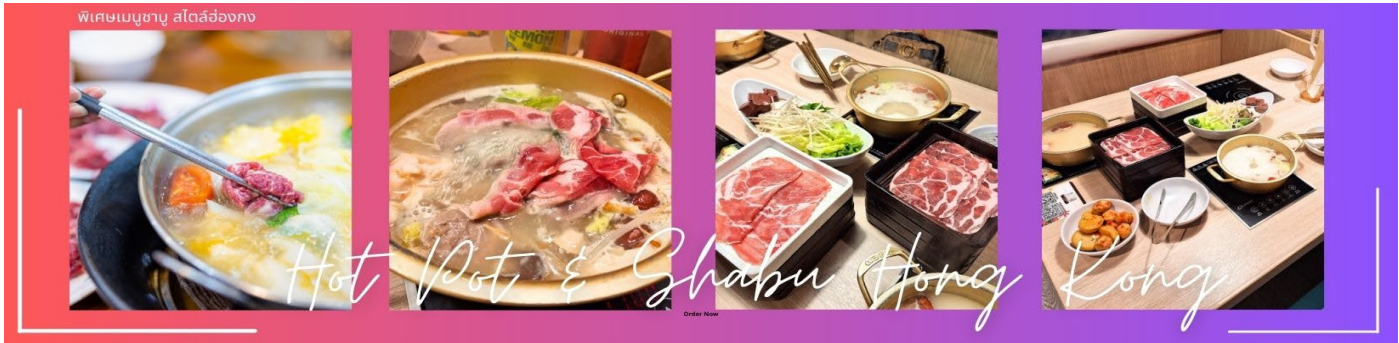
กลางวัน ๑๐ บริการอาหารกลางวัน ณ ภัตตาคาร พิเศษ เมนูชาบู สไตล์ฮ่องกง (6)

จากนั้นนำท่านชม โรงงานจิวเวอรี่ ซึ่งเป็นโรงงานที่มีชื่อเสียงที่สุดของฮ่องกงในเรื่องการออกแบบเครื่องประดับ อาทิเช่น จี้ และแหวนกำหัตน์ ที่สวยงามโดดเด่นไม่เหมือนใคร ซึ่งถือกำเนิดขึ้นที่นี่และมีชื่อเสียงที่สุดใช้เป็นเครื่องประดับติดตัว และเสริมดวงชะตา สินค้าทุกชิ้นมีเอกสารรับประกันคุณภาพเปลี่ยน ซ่อม ได้ตลอดอายุการใช้งาน หากเกิดการชำรุดจากสินค้าไม่ใช่อุบัติเหตุ และนำท่านเลือกซื้อ เครื่องประดับที่ ร้านหยก ซึ่งคนจีนนั้นถือว่าหยกเป็นหิน ที่เป็นตัวแทนของความสวยงามและความบริสุทธิ์ มีความเชื่อว่าหยกมงคล ถ้าพกติดตัวไว้จะอายุยืนและสุขภาพดี