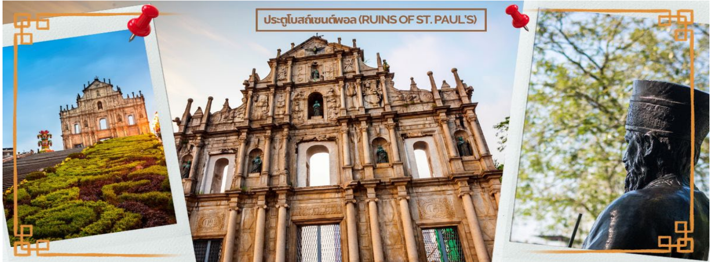
ปรตูลอสลกเซนต์พอล (RUINS OF ST. PAUL'S)

จนกระทั่งเกิดเพลิงไหม้ในปี ค.ศ. 1835 ทั้งวิทยาลัย และโบสถ์ถูกทำลายจนเหลือแต่ด้านหน้าของตึกฐานโบสถ์ส่วนใหญ่ และบันไดด้านหน้าของตึกแสดงให้เห็นถึงสไตล์ผสมระหว่างตะวันออกและตะวันตกและมีอยู่ที่นี่เพียงแห่งเดียวเท่านั้นในโลก