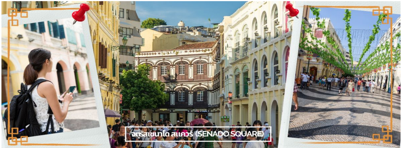
จัตุรัสเซนาโด สแควร์ (SENADO SQUARE)

นำท่านเดินทางสู่ เซนาโดสแควร์ (Senado Square) อิสระให้ท่านได้เดินเที่ยวและเลือกซื้อสินค้าตามอัธยาศัย จัตุรัสเซนาโดเป็นศูนย์รวมของชาวเมืองมาหลายศตวรรษ และยังคงเป็นสถานที่จัดงานเฉลิมฉลองที่ได้รับความนิยมมากที่สุดอยู่ทุกวันนี้ ตั้งอยู่ใกล้กับอาคารวุฒิสภาเก่า วัดซาโก (วันควนไท) ยังแสดงให้เห็นถึงความมีส่วนร่วมของชุมชนชาวจีนในท้องถิ่นในกิจการพลเรือนทั่วไปซึ่งเป็นตัวอย่างที่ชัดเจนของวัฒนธรรมที่หลากหลายของชุมชนมาเก๊า จัตุรัสถูกล้อมรอบด้วยอาคารนีโอคลาสสิกสีพาสเทลที่สะท้อนบรรยากาศแบบเมดิเตอร์เรเนียน