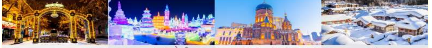
ถนนคนเดินจงหยาง เทศกาลโคมไฟน้ำแข็ง โบสถ์เซนต์โซเฟีย หมู่บ้านหิมะ

*ทางบริษัทฯ ขอสงวนสิทธิ์ในการสลับโปรแกรมทัวร์ตามความเหมาะสมขึ้นอยู่กับสถานการณ์ปัจจุบัน โดยคำนึงถึงผลประโยชน์ของลูกค้าเป็นสำคัญ