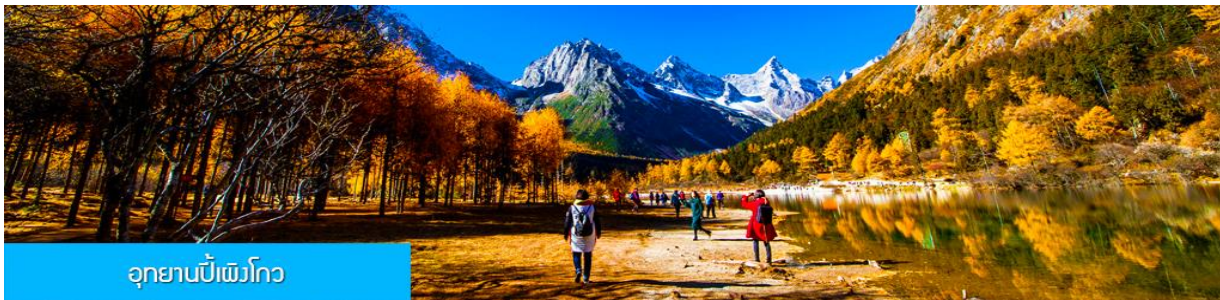
อุทยานปีเฉิงโกว