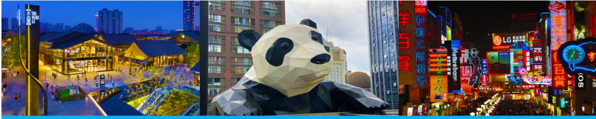
ถนนไท่กุ่หลี่ และวัดต้าเจี๊ว