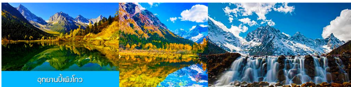
อุทยานปีศาจโกว