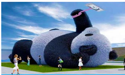
ตุ๊กตาแพนด้าอนเซลพี

หลังอาหารนำท่านเดินทางสู่ เมืองตูเจียงเยียน 都江堰 (ระยะทาง 234 กม. ใช้เวลาเดินทางราว 4 ชั่วโมง) ระหว่างเดินทางท่านสามารถชมทัศนียภาพธรรมชาติอันงดงามของสองข้างถนนขณะที่รถแล่นผ่าน ที่มีทั้งภูเขาหิมะสูง หุบเขา ธารน้ำ และทุ่งหญ้าบนที่ราบสูง หรือพักผ่อนตามอัธยาศัยบนรถระหว่างเดินทาง