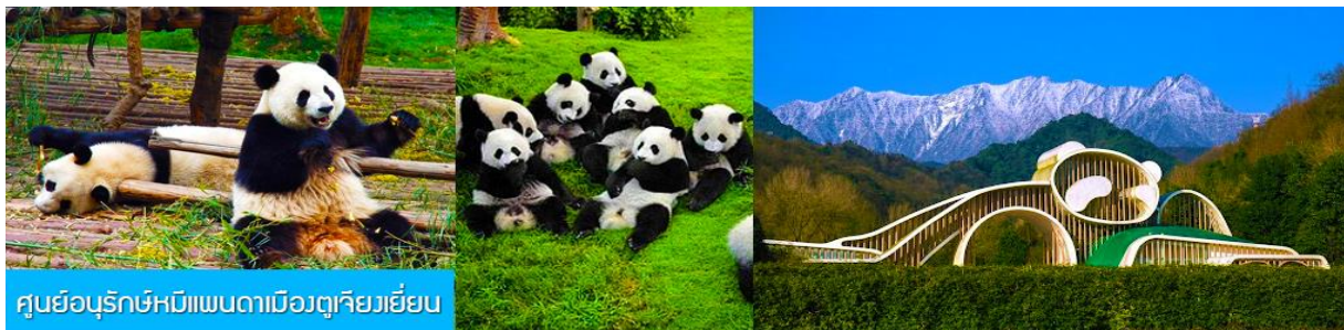
ศูนย์อนุรักษ์หมีแพนดาเมืองตู่เจียงเยียน