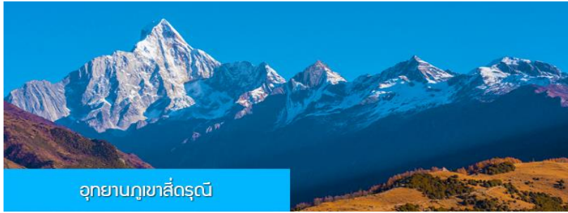
อุทยานภูเขาสีครุณี