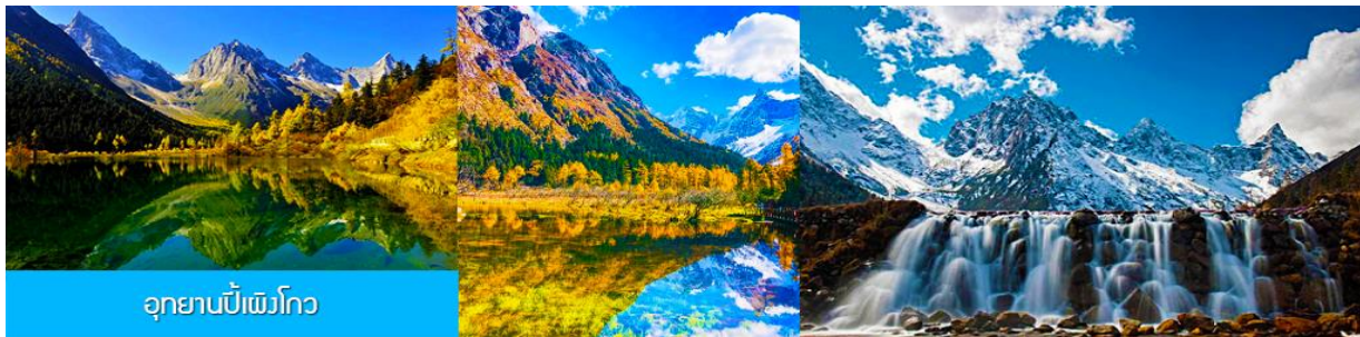
อุทยานปีเพ็งโกว

หลังอาหารเช้าท่านเดินทางสู่ อุทยานปีผิงโกว 毕鹏沟景区 (ระยะทาง 300 กม. ใช้เวลาเดินทางราว 4 ชั่วโมงครึ่ง) โดยรถจะ วิ่งผ่าน ถนนสาย หลี่เซียงลู่ 理小路 ที่ได้ชื่อว่าเป็นถนนที่มีวิวทิวทัศน์สวยงามที่สุดเส้นหนึ่งของจีน และเป็นเส้นทางผ่านชมวิวที่สวยงามที่สุดของมณฑลเสฉวน ระหว่างทางท่านจะได้สัมผัสกับทิวทัศน์ที่สวยงามราวภาพเขียน ที่มีลักษณะภูมิประเทศที่สลับซับซ้อน ประกอบด้วย ภูเขาหิมะสูง หุบเขาเหวลึกที่มีสายน้ำไหลผ่าน ในฤดูหนาวท่านจะได้พบกับภูเขาและป่าไม้ที่ปกคลุมโดยหิมะขาวโพลน ในฤดูใบไม้ผลิและฤดูร้อนที่นี้จะเขียวชอุ่มด้วยผืนป่า และในฤดูใบไม้ร่วงท่านจะได้สัมผัสความสวยงามของใบไม้เปลี่ยนสีอันสวยงาม (เนื่องจากถนนสายนี้เป็นถนนสองเลนที่ให้รถวิ่งสวนได้ ในช่วงเทศกาลอาจมีการจราจรที่คับคั่ง เนื่องจากมีนักท่องเที่ยวจีนนิยมขับรถผ่านและแวะจอดข้างทางจนทำให้การจราจรติด หรือ ถนนถูกปิดเพราะเกิดจากดินสไลด์จนรถไม่สามารถสัญจรไปมาได้ ทางทัวร์สงวนสิทธิ์ในการปรับเปลี่ยนเส้นทางเดินทาง)