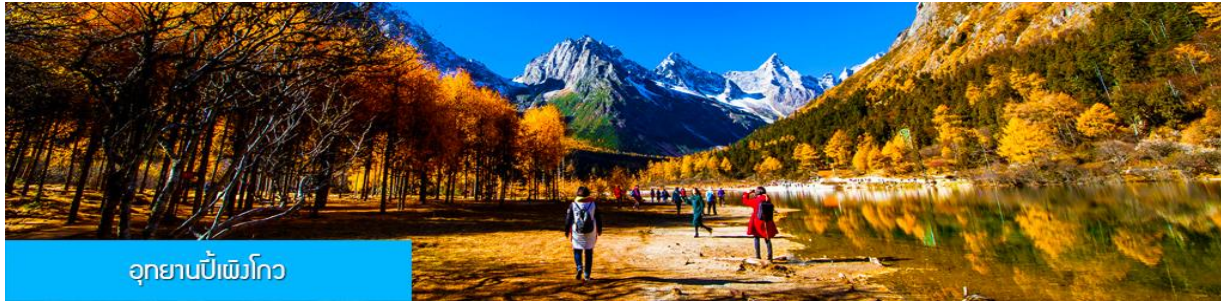
อุทยานปีเพ็งโกว