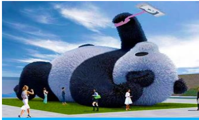
ตุ๊กตาแพนด้าอนเซลฟี