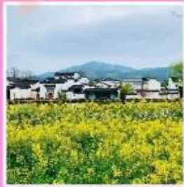
หมู่บ้านโบราณเจียงชาน