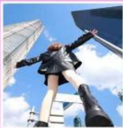
3 ตึกใหญ่ แห่งเมือง เซี่ยงไฮ้