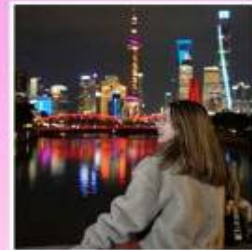
สะพานจ่าฝูจู่เดี่ยว