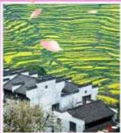
หมู่บ้านโบราณหวงหลิ่ง