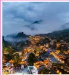
หุบเขาเทวดาฉงชียง