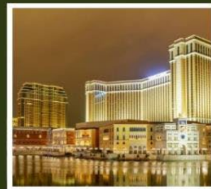
เดอะ เวเนเซียน

ฟูจิยามะ ทาวเวอร์ ขึ้นชมฟูจิจากสวนสนุกที่ไม่เหมือนใคร ชมไร่ชาอินุชิซะซะมะ อันเลื่องชื่อ สักการะพระพุทธรูปอุชิคุโดบุทสึ องค์พระใหญ่ที่สุดของประเทศญี่ปุ่น เปลี่ยนบรรยากาศนั่งรถไฟรมทะเลสุดคลาสสิก ในเมืองคามาคุระ กราบไหว้ขอพรกับเทพเจ้าองค์ที่สวยเอี้ย วัดเปากง สัมผัสความอลังการของ เดอะ เวเนเซียน รีสอร์ทระดับโลกคลาส ฟักออนเซ็น 1 คืน!!! // อาหาร : บุฟเฟ่ต์ชาบูยักษ์, บุฟเฟ่ต์ชาบู กรุ๊ปสบายๆ เพียง 25 ท่านเท่านั้น!!!