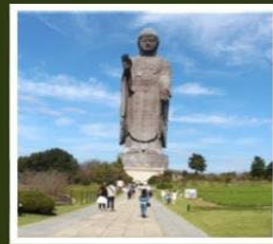
พระพุทธรูปอุชิคุโดบุทสึ