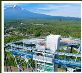
ฟูจิยามะ ทาวเวอร์