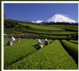
ไร่ชาอินุชิซะซะมะ