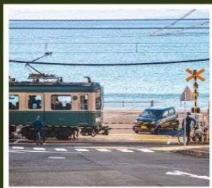
รถไฟเอโตะเด็น