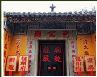
วัดเปากง