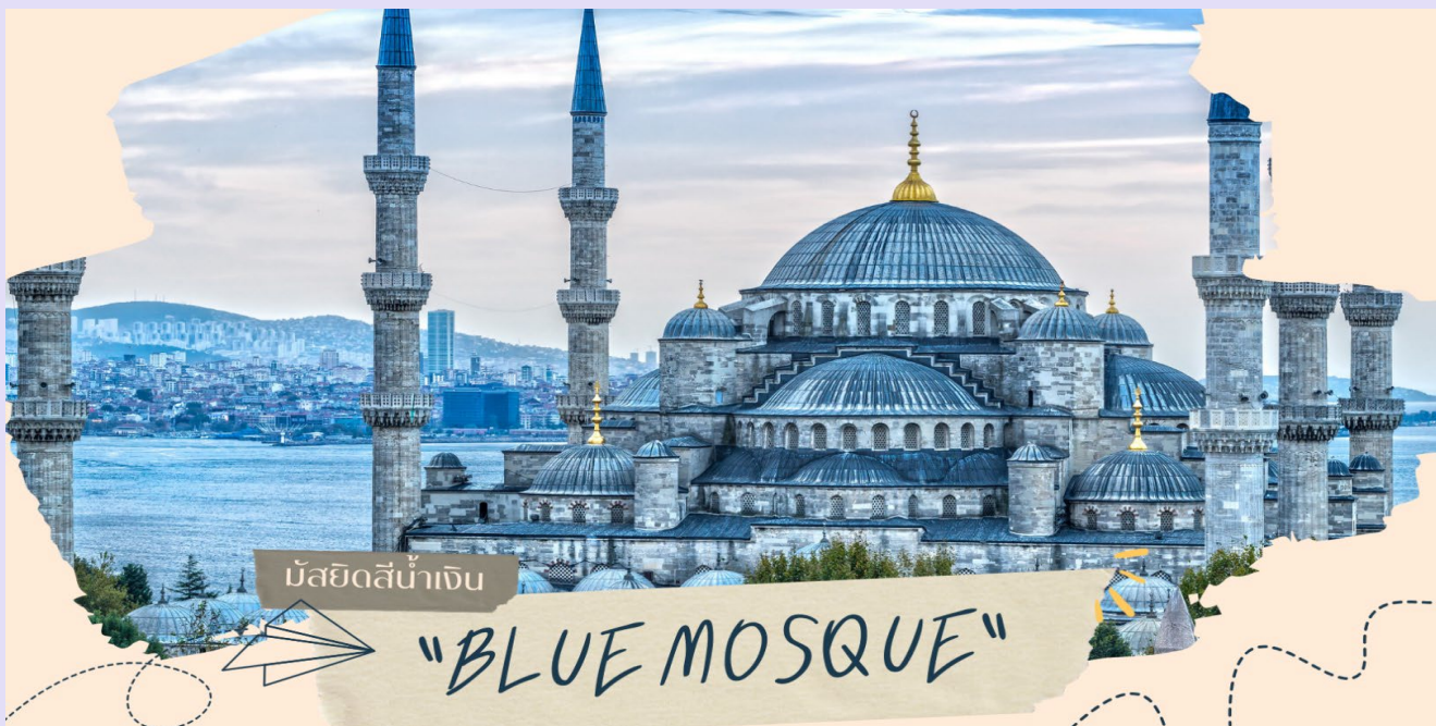
มัสยิดสีน้ำเงิน

เรือนแสน ใช้เวลาในการก่อสร้างนานถึงระหว่างปี ค.ศ. 1609-1616 โดยตั้งชื่อตามสุลต่านผู้สร้างซึ่งก็คือ SULTAN AHMED นั่นเอง