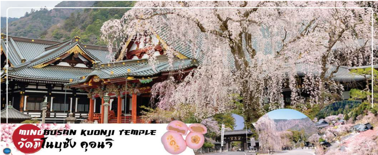
MINOBUSSHIN KUONJI TEMPLE วัดมิโนบุซัง คองนิจิ