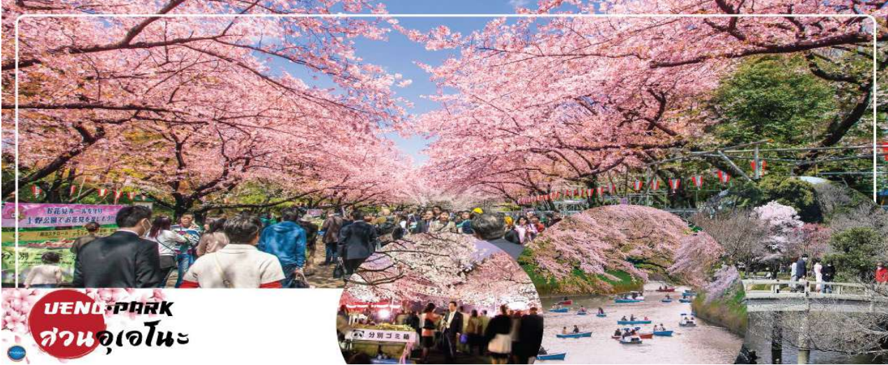
UENO PARK สวนอุเอโนะ

วันที่ห้า เมืองนาริตะ – กรุงโตเกียว – สวนอุเอโนะ (จัดชมซากุระขึ้นกับภูมิอากาศ) – ไทโยสุ เซนเคียวค บันไร – ย่านโอไดบะ – ห้างไดเวอร์ซิตี – เมืองนาริตะ – อีออน มอลล์