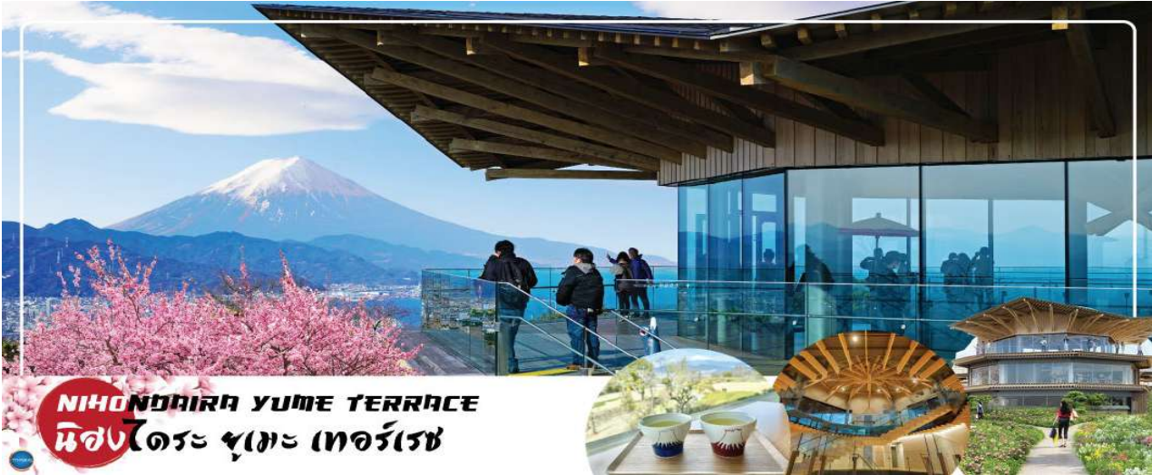
NIHONDAIRA YUME TERRACE นิสงไดระ ยูเมะ เทอร์เรซ

เมืองนาโกย่า - จังหวัดชิซุโอกะ - นิสงไดระ ยูเมะ เทอร์เรซ - วัดมิโนบุซังคองนิจิ(จุดชมซากุระขึ้นกับภูมิกาคัต) - กระจ่าไฟฟ้ามินุบุซัง - ออนเซ็น + ชาบูยักษ์