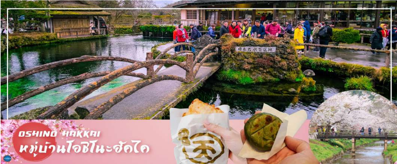
OSHINO HAKKAI หมู่บ้านโอชิโนะฮัคไค

เมืองยามานาชิ - หมู่บ้านโอชิโนะฮัคไค (จุดชมซากุระขึ้นกับภูมิลูกฟ้า) - การเรียนพิธีชงชาญี่ปุ่น - กรุงโตเกียว - ชมแมวยักษ์ 3 มิติ พร้อมช้อปปิ้ง ย่านชินจูกุ - เมืองนาริตะ