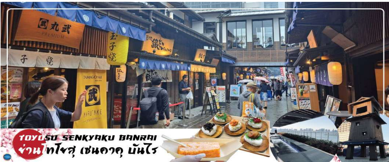
TOYOSU SENKYAKU BANRAI ย่านโทโยสุ เซนคาคุ บันไร

จากนั้นนำท่านสู่ ย่านโทโยสุ เซนคาคุ บันไร (Toyosu Senkyaku Banrai) (ใช้เวลาเดินทางประมาณ 25 นาที) เป็นสถานที่ท่องเที่ยวใหม่ที่ตั้งอยู่ในย่าน Toyosu ของ Tokyo ที่เป็นเหมือนตลาดในธีมย้อนยุคสมัยเอโดะ เปิดให้บริการในวันที่ 1 กุมภาพันธ์ 2024 โดยมีทั้งตลาด อาหาร และสถานบันเทิง นอกจากนี้ยังมีออนเซ็น 24 ชั่วโมงที่ช่วยให้เราผ่อนคลายอีกด้วย เป็นตลาดที่มีทั้งอาหารทะเลสดใหม่จาก Toyosu Market และอาหารญี่ปุ่นหลากหลายชนิด เช่น ซูชิ เทมปุระ และราเมน ที่นี่มีร้านค้าจำนวนมากที่ขายของที่ระลึกและวัตถุดิบตามฤดูกาล นอกจากนี้ยังมีจุดออนเซ็นแช่เท้า (ฟรี) ที่ยังชมบรรยากาศของโตเกียวได้อีกด้วย