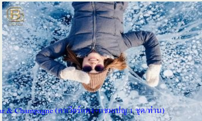
กลางวัน รับประทานอาหารแบบปิกนิก พิเศษ!! ฟรี Caviar & Champagne (คาเวียร์แดง + แชมเปญ 1 ชุด/ท่าน)