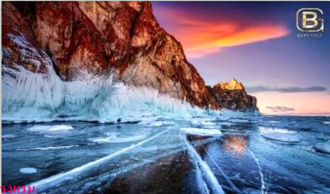
คืนที่ 2 รับประทานอาหารเช้า ร้านอาหารท้องถิ่น หรือ โรงแรมพักที่ TOCHKA BAIKALA หรือเทียบเท่า

(โรงแรมที่ระบุในรายการทัวร์เป็นเพียงโรงแรมที่นำเสนอเบื้องต้นเท่านั้น ซึ่งอาจมีการเปลี่ยนแปลงแต่โรงแรมที่เข้าพักจะเป็นโรงแรมระดับเทียบเท่ากัน โดยจะแจ้งพร้อมใบนัดหมาย 5-7 วันก่อนการเดินทางและขอสงวนสิทธิ์ในการปรับเปลี่ยนที่พักไปเมืองใกล้เคียงในกรณีที่มีเหตุแปรหรือเทศกาล)