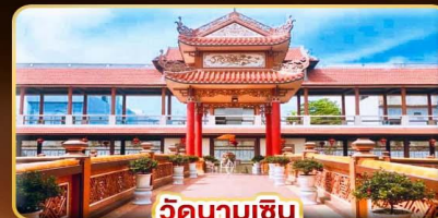
วัดนามเชิน