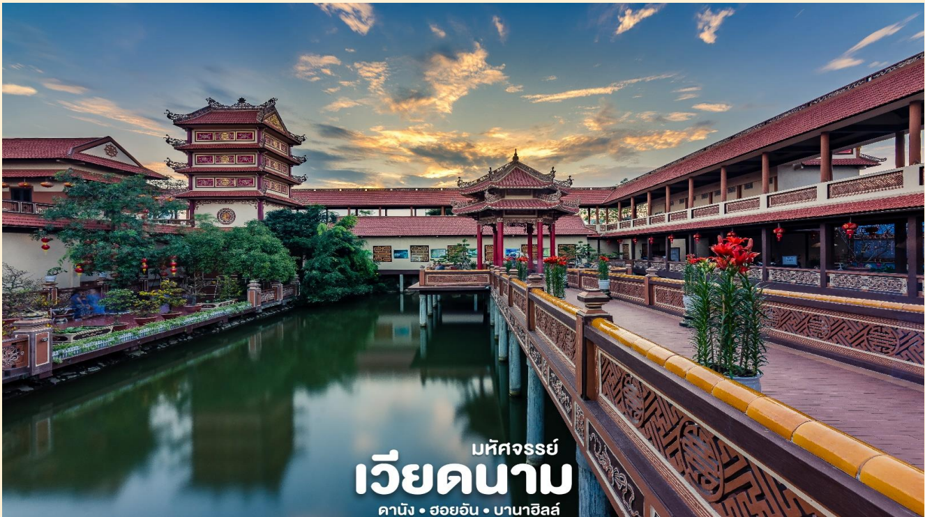
มัทศจรรย์ เวียดนาม ดานัง • ฮอยอัน • บานาฮิลล์

นำท่านชม วัดนามเซิน (Nam Son Pagoda) หรือ เจดีย์นัมเซิน ถูกสร้างขึ้นในปี 1962 เจดีย์นัมเซินมีรูปแบบสถาปัตยกรรมตามแบบฉบับของเวียดนามตอนกลางดั้งเดิม เจดีย์แบ่งออกเป็นหลายพื้นที่โดยมีลักษณะเฉพาะของตัวเอง ได้แก่ ทะเลสาบฟองซัน สะพานทามทัง ศาลาวงแหงียน เหวียต อาคารเกสต์เฮาส์ ห้องโถงหลัก สะพานด่งทุ เป็นต้น