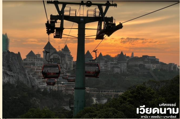
มัทศจรรย์ เวียดนาม ดานัง • ฮอยอัน • บานาฮิลล์

นั่งกระเช้าขึ้นสู่บานาฮิลล์ กระเช้าแห่งบานาฮิลล์นี้ได้รับการบันทึกสถิติโลกโดย World Record ว่าเป็นกระเช้าไฟฟ้าที่ยาวที่สุด ประเภท Non Stop โดยไม่หยุดแะมีความยาวทั้งสิ้น 5,042 เมตร และเป็นกระเช้าที่สูงที่สุด 1,294 เมตร นักท่องเที่ยวจะได้สัมผัสบรรยากาศและบางจุดมีเมฆลอยต่ำกว่ากระเช้าพร้อมอากาศบริสุทธิ์อันสดชื่นจนทำให้ท่านอาจลืมไปเสียด้วยซ้ำว่าที่นี่ไม่ใช่ยุโรปเพราะอากาศที่หนาวเย็นเฉลี่ยตลอดทั้งปีประมาณ 10 องศาเท่านั้น