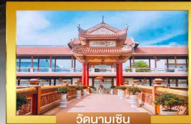
วัดนามเชิน