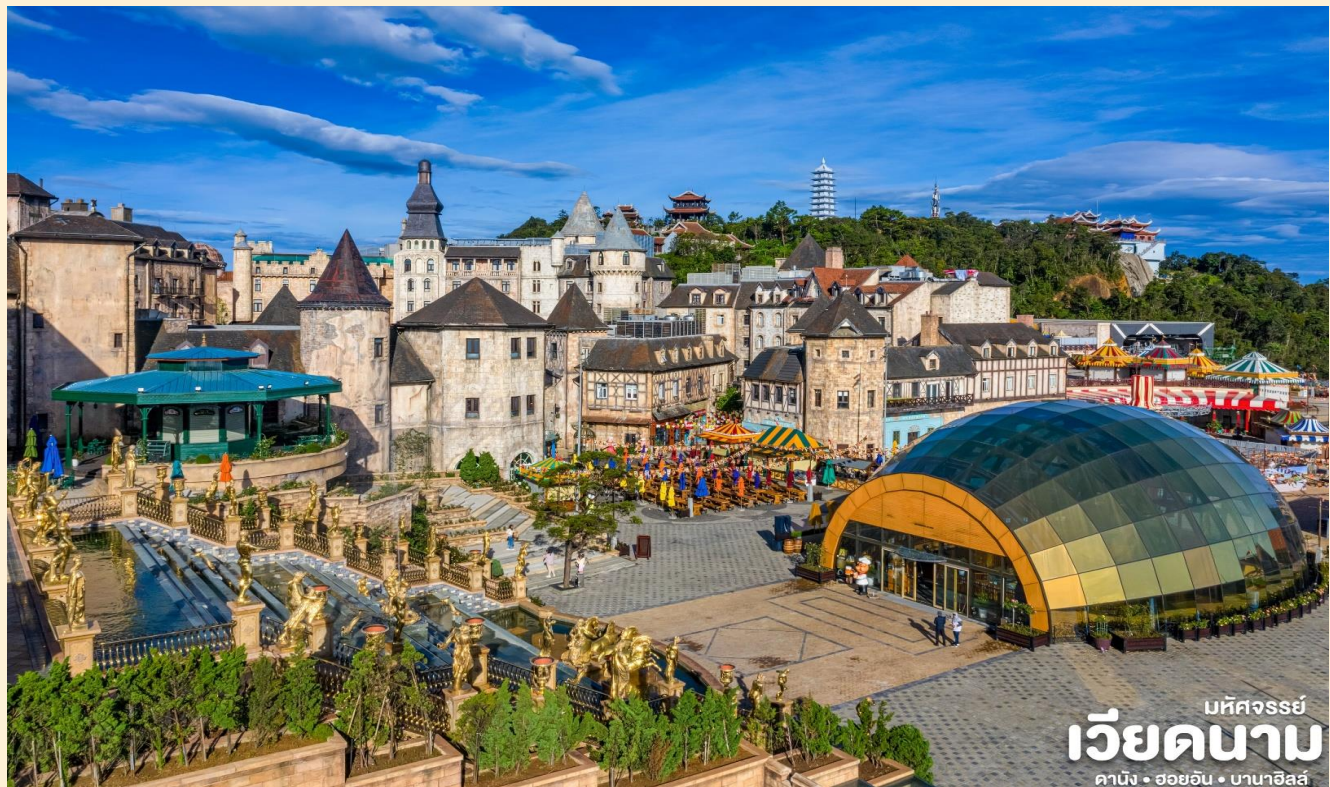
มัทศจรรย์ เวียดนาม ดานัง • ฮอยอัน • บานาฮิลล์