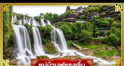
หมู่บ้านฟุรงเจิน