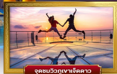
จุดชมวิวกูเขาเจ็ดดาว