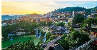
เมืองโบราณฝูหลงเจิน