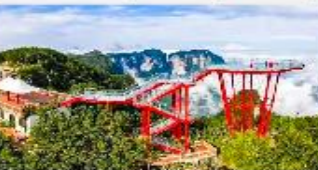
ภูเขาเจ็ดดาว