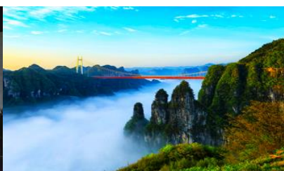
อุทยานป่าไม้แห่งชาติไฉ่จ้าย