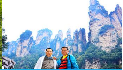
ชมจุดชมวิวลีฟท์แก้ว

วันที่ห้า เมืองจางเจียเจี๋ย -เลือกซื้อโปรแกรมทัวร์เสริมออฟชั่น อุทยานอวตารจุดชมวิวจินเปียนซี-ชมจุดชมวิวลีฟท์แก้ว ร้านหยก- ร้านไบซา – เดินทางกลับเมืองหยี่ซัง