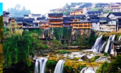
เมืองโบราณผู่หลงเจิ้น