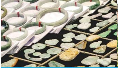
ศูนย์จำหน่ายผลิตภัณฑ์หยก

https://hk.trip.com/hotels/guzhang-hotel-detail-68614854/chaxitai-holiday-hotel/