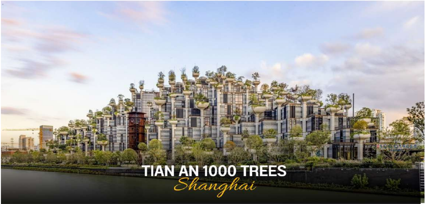
TIAN AN 1000 TREES Shanghai