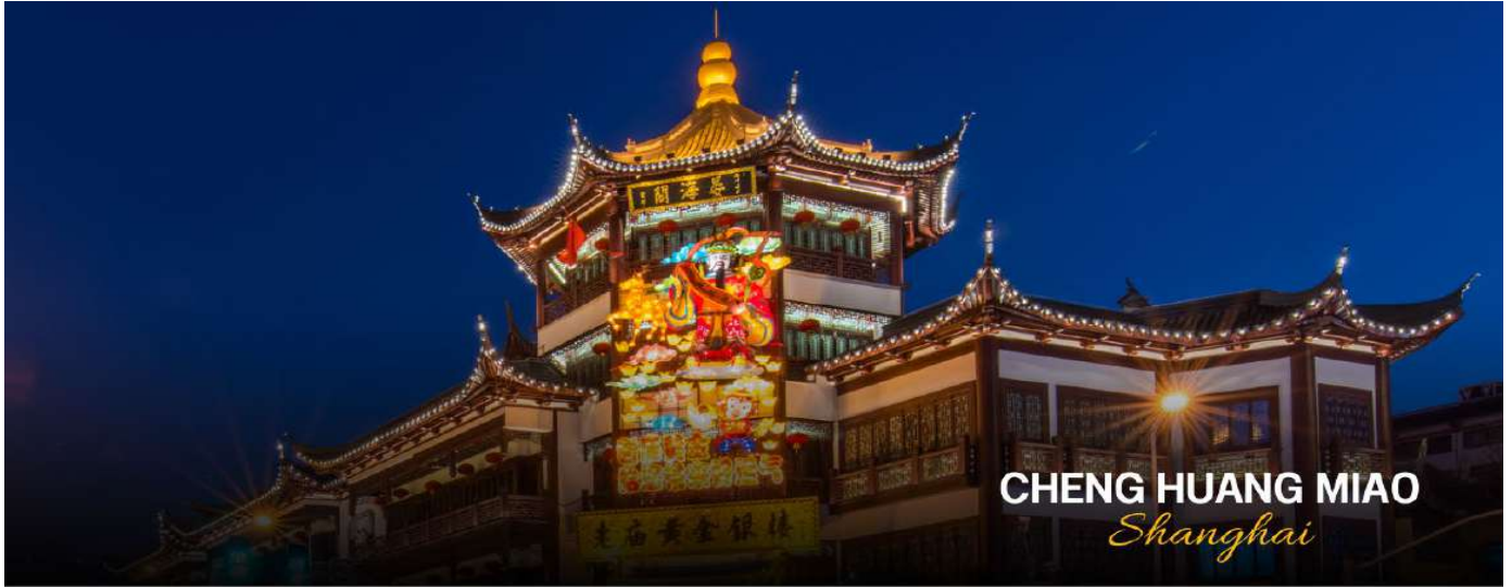
CHENG HUANG MIAO Shanghai