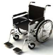
การรับการดูแลเป็นพิเศษ

กรณีผู้เดินทางต้องการความช่วยเหลือเป็นพิเศษ อาทิเช่น การใช้วีลแชร์ กรุณาแจ้งบริษัทฯ อย่างน้อย 7 วันก่อนการเดินทาง มิฉะนั้นบริษัทฯ จะไม่สามารถจัดการล่วงหน้าได้ เนื่องจากการขอวีลแชร์ในสนามบินนั้น ต้องมีขั้นตอนในการขอล่วงหน้า และบางสายการบินอาจมีการเรียกเก็บค่าใช้จ่ายทั้งทางสนามบินในไทยและในต่างประเทศ ซึ่งผู้เดินทางสามารถสอบถามกับเจ้าหน้าที่ได้โดยตรงก่อนทำการจอง และหากในขณะของท่านมีผู้ต้องการดูแลพิเศษ เช่น ผู้ที่นั่งรถเข็น (Wheelchair), เด็ก, ผู้สูงอายุและผู้ที่มีโรคประจำตัวหรือไม่สะดวกในการเดินทางท่องเที่ยวในระยะเวลายาวเกินกว่า 4 - 5 ชั่วโมงติดต่อกัน ท่านและครอบครัวต้องให้การดูแลสมาชิกภายในครอบครัวของตนเอง เนื่องจากการเดินทางเป็นหมู่คณะ หัวหน้าทัวร์มีความจำเป็นต้องดูแลคณะทัวร์ทั้งหมด