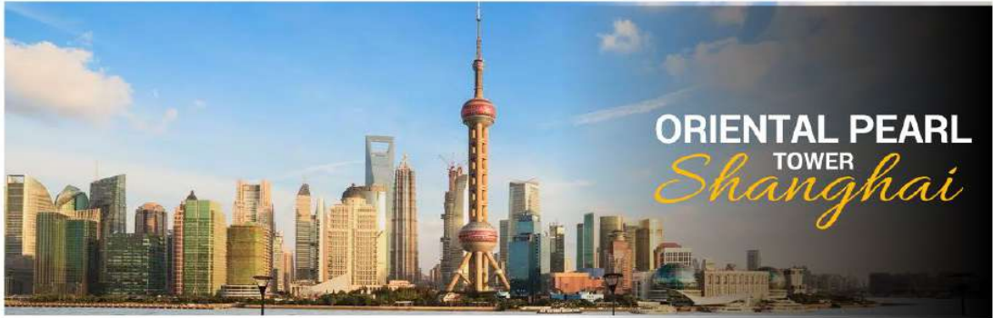
ORIENTAL PEARL TOWER Shanghai