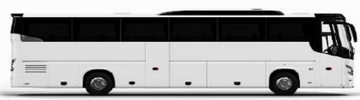
ตัวอย่างรถโดยสาร 1 คัน

ค่าที่พักตามที่ระบุในรายการหรือเทียบเท่าระดับเดียวกัน (พักห้องละ 2 ท่าน) หากประเภทห้องที่ท่านริเสกษาเดิม อาทิ เช่น ริเสกษาห้องพักเป็น TWIN BED หรือ DOUBLE BED ทางบริษัทขอสงวนสิทธิ์ในการปรับประเภทห้องพัก เป็นตามโรงแรมมีอยู่ โดยไม่ต้องแจ้งให้ทราบล่วงหน้า