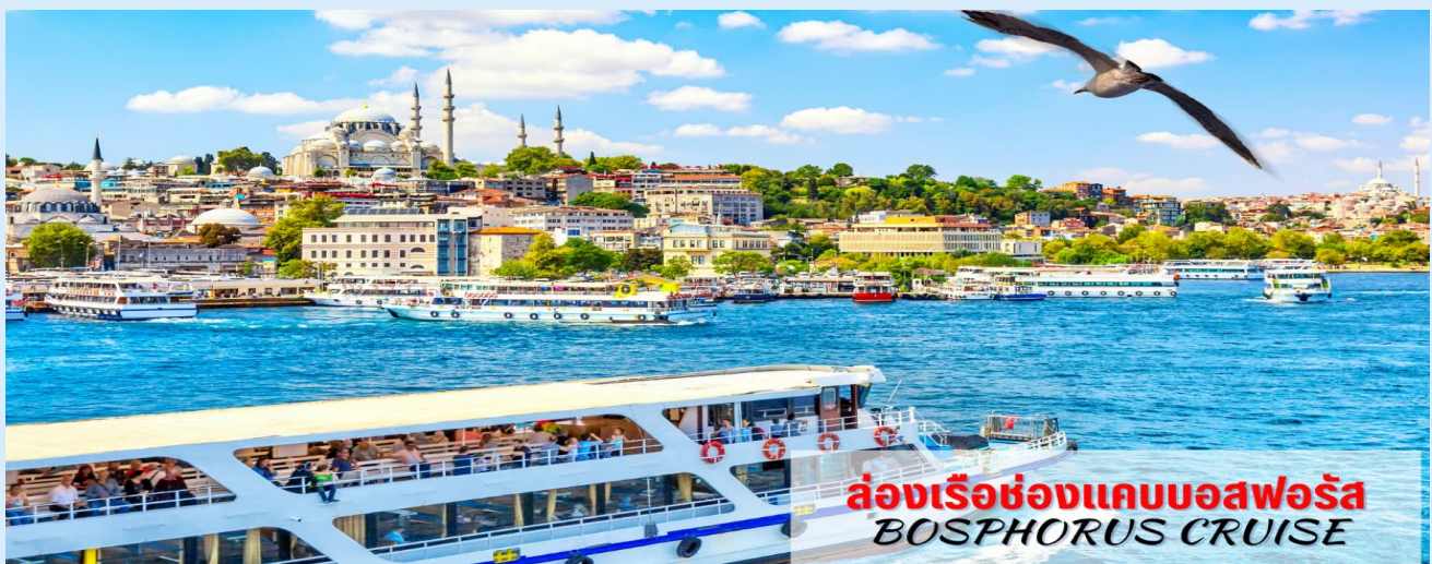
ล่องเรือชมช่องแคบบอสฟอรัส BOSPHORUS CRUISE

○○ OPTION TOUR ○○ HIGHLIGHT!! ล่องเรือชมช่องแคบบอสฟอรัส (Bosphorus Cruise) ช่องแคบที่เชื่อมทะเลดำ (The Black Sea) ทะเลมาร์มา (Sea Of Marmara) มีความยาวประมาณ 32 กม. ความกว้างตั้งแต่ 500 เมตรจนถึง 3 กิโลเมตร ซึ่งถือว่าเป็นที่สุดของยุโรปและเอเชียมาพบกันที่นี่ยังนอกจากความสวยงามแล้ว ช่องแคบบอสฟอรัสยังเป็นจุดยุทธศาสตร์ที่สำคัญยิ่งในการป้องกันประเทศตุรเคียอีกด้วย ขณะล่องเรือท่านจะได้เพลิดเพลินกับการชมทิวทัศน์ที่สวยงามทั้งสองข้างทางไม่ว่าจะเป็นพระราชวังโดลมาบาห์เซ่หรือบ้านเรือนสไตล์ยุโรปของบรรดาเศรษฐีตุรเคียและมีป้อมปืนตั้งเรียงราย