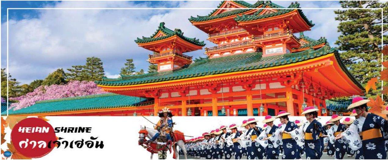
HEIAN SHRINE ศาลเจ้าเฮอัน

เมืองนาโกย่า – เมืองเกียวโต – ศาลเจ้าเฮอัน – การเรียนพิธีชงชาญี่ปุ่น – เมืองโอซาก้า – LALAPORT & MITSUI OUTLET PARK OSAKA KADOMA – ช้อปปิ้งชินไซบาชิ