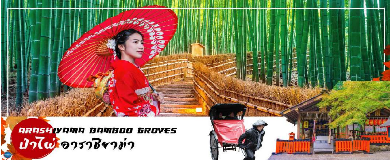
ARASHIYAMA BAMBOO GROVES ป่าไผ่ อาราชियามา

01.00 น. เห็นฟ้าสูก เมืองโอซาก้า ประเทศญี่ปุ่น โดยเที่ยวบินที่ XJ612