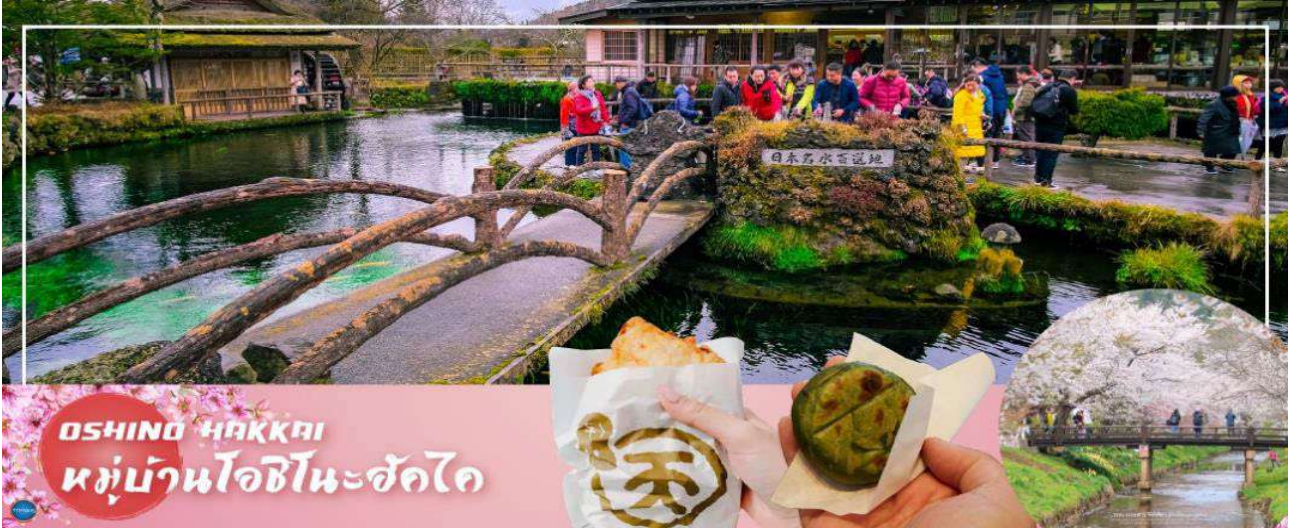
OSHINO 八ヶ池 หมู่บ้านโอชิโนะฮักไค

เมืองยามานาชิ – หมู่บ้านโอชิโนะฮักไค(จุดชมซากุระขึ้นกับภูมิกามาคา) – การเรียนพิธีชงชาญี่ปุ่น – FUJIYAMA TOWER จุดชมวิฟูจิซึ่งแบบพาโนรามา – กรุงโตเกียว – ย่านโอไดบะ – ห้างไดเวอร์ซิตี – เมืองนาริตะ