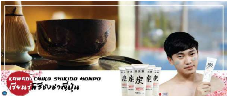
KAWABO CHIKO SHIKIDO HONPO เรียนพิธีชงชาญี่ปุ่น

จากนั้นนำท่านสัมผัสวัฒนธรรมดั้งเดิมของญี่ปุ่น นั่นก็คือ การเรียนพิธีชงชาญี่ปุ่น (Sado) (ใช้เวลาเดินทางประมาณ 30 นาที) โดยการชงชาตามแบบญี่ปุ่นนั้น มีขั้นตอนมากมาย เริ่มตั้งแต่การชงชา การรับชา และการดื่มชา ทุกขั้นตอน นั้นล้วนมีพิธีรายละเอียดที่บรรจงและสวยงามเป็นอย่างมาก พิธีชงชาไม่ใช่แค่รับชมอย่างเดียว ยังเปิดโอกาสให้ท่านได้มีส่วนร่วมในพิธีการชงชานี้อีกด้วย และให้ท่านได้อิสระเลือกซื้อของที่ระลึกตามอัธยาศัย