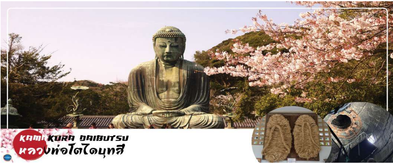
KAMAKURA DAIBUTSU หลวงพ่อกโตโตคุชิน

07.55 น. เดินทางถึง ท่าอากาศยานนานาชาตินาริตะ ประเทศญี่ปุ่น นำท่านผ่านขั้นตอนการตรวจคนเข้าเมืองและศุลกากร เรียบร้อยแล้ว (เวลาที่ญี่ปุ่น เร็วกว่าเมืองไทย 2 ชั่วโมง กรุณาปรับนาฬิกาของท่านเพื่อความสะดวกในการนัดหมายเวลา) ***สำคัญมาก!! ประเทศญี่ปุ่นไม่อนุญาตให้นำอาหารสด จำพวก เนื้อสัตว์ พืช ผัก ผลไม้ เข้าประเทศ หากฝ่าฝืนมีโทษปรับและจับ