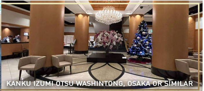
KANKU IZUMI OTSU WASHINTONG, OSAKA OR SIMILAR

วันที่ 5 สนามบินคันไซ – กรุงเทพ (ดอนเมือง) (B/I-/-)