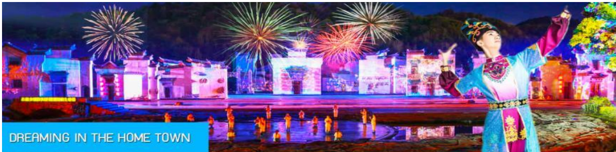
DREAMING IN THE HOME TOWN

หลังอาหารนำท่านเดินทางเข้าที่พัก หรือท่านสามารถเลือกซื้อโปรแกรมเสริม เป็นบัตรชมการแสดง ชุด DREAMING IN THE HOME TOWN เป็นการแสดงบนเวทีขนาดใหญ่ที่จัดสร้างขึ้นกลางแจ้ง ท่ามกลางธรรมชาติที่มีภูเขาเป็นฉากหลัง ใช้ทุนสร้างกว่า 280 ล้านบาท เป็นการแสดงที่น่าดูชมที่สุดในมณฑลเจียงซี แต่ละครจากการแสดงมีการออกแบบเวที ฉากประกอบที่พิถีพิถัน ประณีต และอลังการ ใช้ทีมงานนักแสดงหลายร้อยคน และระบบแสง สี เสียงที่ทันสมัยประกอบในการแสดง