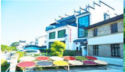
หมู่บ้านโบราณ สือเหมินซุน