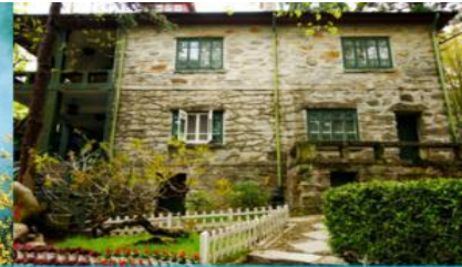
เรือนรับรอง หม่อมหลู