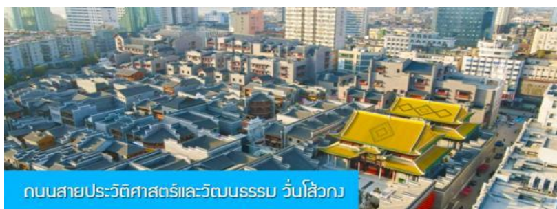
ถนนสายประวัติศาสตร์และวัฒนธรรม วันโส้วกง

พักที่ โรงแรม JIANGNAN HAOTING HOTEL ระดับ 4 ดาวท้องถิ่นหรือเทียบเท่าในเมืองซ่งเหรา