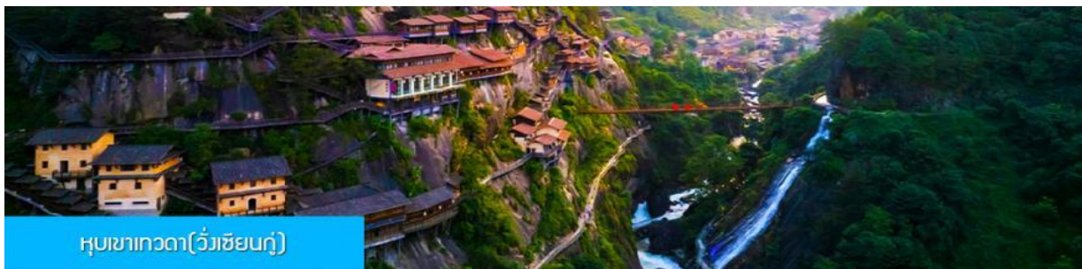
หุบเขาเทวดา(วังเซียนกู่)

หลังอาหารนำท่านเดินทางสู่เมือง ซังเหรา 上饶 (ระยะทาง 127 กม. ใช้เวลาเดินทางโดยรถบัสราว 2 ชั่วโมง)