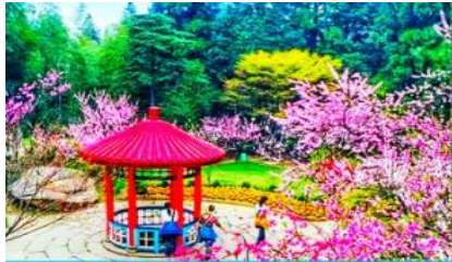
สวนฮวาจิ้ง