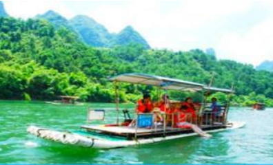
ล่องแพไม้ไผ่