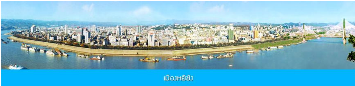
เมืองหยี่ชัง