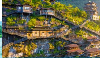
อุทยาน วังเซียนกู่