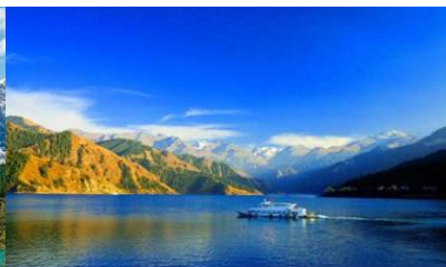
ล่องเรือทะเลสาบเทียนฉือ