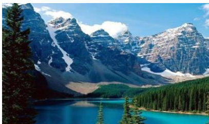
ภูเขาเทียนชาน

พักที่ MERCURE HOTEL โรงแรมระดับ 4 ดาวท้องถิ่นหรือเทียบเท่าในเมืองอูร์มุฉี