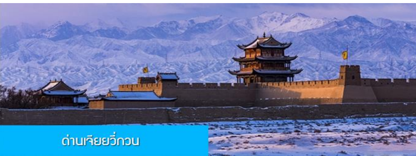
ด่านเจียยวี่กวน