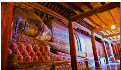
วัดพระใหญ่

พักที่ SI LU QIAN XI HOTEL โรงแรมระดับ 4 ดาวท้องถิ่น หรือเทียบเท่าในเมืองจางเยี่ยน