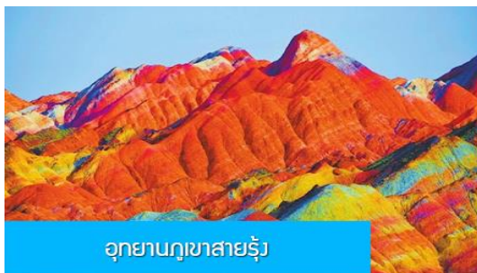
อุทยานภูเขาสายรุ้ง