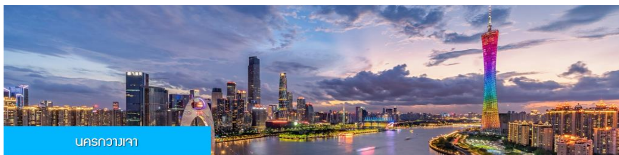
นครกวางเจา