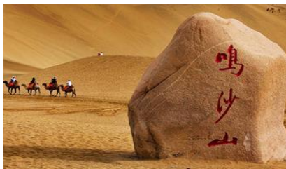
เดินกรายหมีงาช้าง

หลังอาหารให้ท่าน มีเวลาเดินเล่น ช้อปปิ้งใน ตลาดกลางคืน ซาโจว 沙洲夜市 ให้ท่านเลือกซื้อของที่ระลึกของเส้นทางสายไหมได้ตามอัธยาศัย