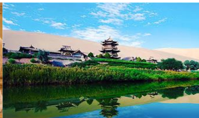
สระน้ำวพระจันทร์