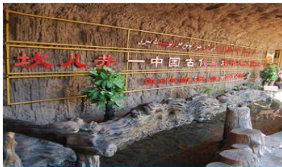
ระบบชลประทานอู๋หลู่ฟาน

ค่ำ รับประทานอาหารค่ำ ณ ภัตตาคาร พักที่ HAMPTON BY HILTON HOTEL โรงแรมระดับ 4 ดาวหรือเทียบเท่าในเมืองอู๋หลู่ฟาน