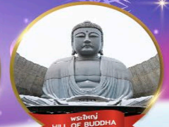
พระใหญ่ HILL OF BUDDHA