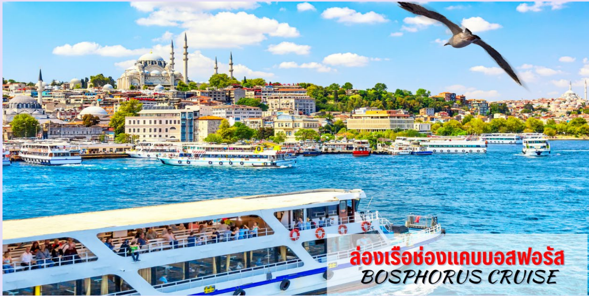
ล่องเรือช่องแคบบอสฟอรัส BOSPHORUS CRUISE

นำท่าน ล่องเรือชมช่องแคบบอสฟอรัส (Bosphorus Cruise) ช่องแคบที่เชื่อมทะเลดำ (The Black Sea) ทะเลมาร์มา (Sea Of Marmara) มีความยาวประมาณ 32 กม. ความกว้างตั้งแต่ 500 เมตรจนถึง 3 กิโลเมตร ซึ่งถือว่าเป็นที่สุดของยุโรปและเอเชียมาพบกันที่นี่ยังนอกจากความสวยงามแล้ว ช่องแคบบอสฟอรัสยังเป็นจุดยุทธศาสตร์ที่สำคัญยิ่งในการป้องกันประเทศตุรเคียอีกด้วย ขณะล่องเรือท่านจะได้เพลิดเพลินกับการชมวิวทัศนที่สวยงามทั้งสองข้างทางไม่ว่าจะเป็นพระราชวังโดลมาบาห์เซ่หรือบ้านเรือนสไตล์ยุโรปของบรรดาเศรษฐีตุรเคียและมีป้อมปืนตั้งเรียงราย