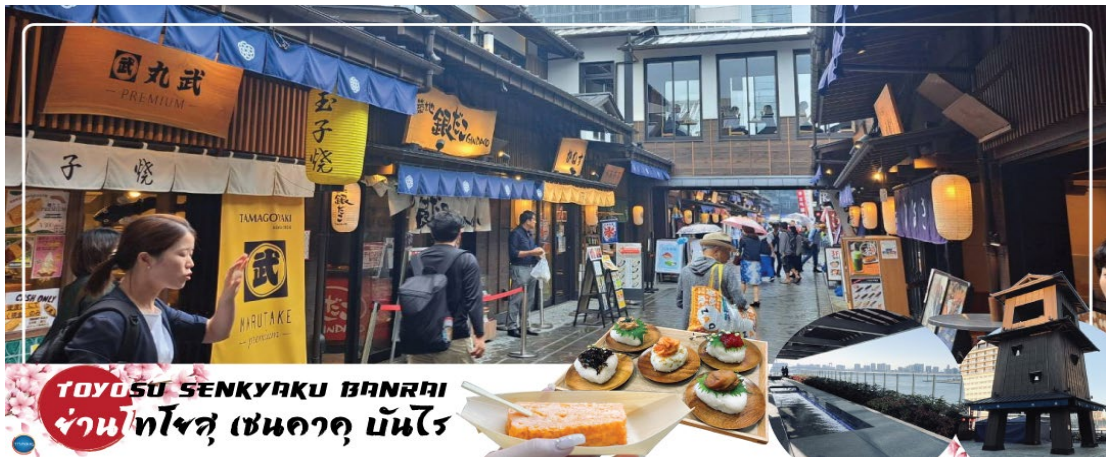
TOYOSU SENKYAKU BANRAI ย่านโทโยสุ เซนคาคุ บันไร

นอกจากนี้ยังมีจุดออนเซ็นแช่เท้า(ฟรี) ที่ยังชมบรรยากาศของโตเกียวได้อีกด้วย