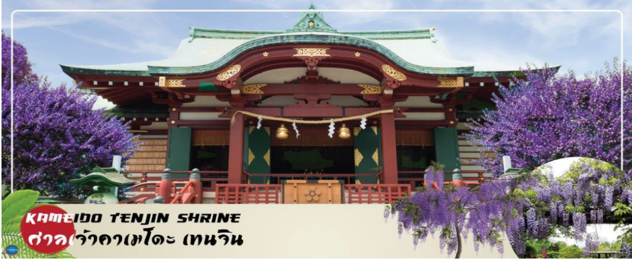
KAMEIDO TENJIN SHRINE ศาลเจ้าคามะโตะ เทนจิน

กรุงโตเกียว - ศาลเจ้าคามะโตะ เทนจิน (จุดชมดอกวิสทีเรียขึ้นอยู่กับสภาพอากาศ) - โทโยสุ เซนเคียวคิ บันไร - ชมแมวยักษ์ 3 มิติ พร้อมช้อปปิ้งย่านชินจูกุ - เมืองนาริตะ