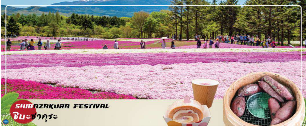
SHIBAZAKURA FESTIVAL ชิบะซากุระ