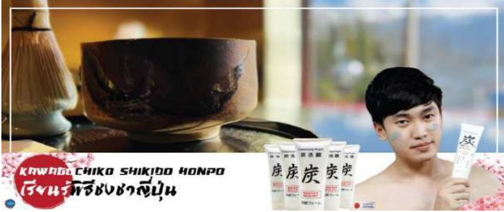
KAWABU CHIKO SHIKIDO HONPO ร้านพิธีชงชาญี่ปุ่น

จากนั้นนำท่านสัมผัสวัฒนธรรมดั้งเดิมของญี่ปุ่น นั่นก็คือ การเรียนพิธีชงชาญี่ปุ่น (Sado) (ใช้เวลาเดินทางประมาณ 20 นาที) โดยการชงชาตามแบบญี่ปุ่นนั้น มีขั้นตอนมากมาย เริ่มตั้งแต่การชงชา การรับชา และการดื่มชาทุกขั้นตอน นั้นล้วนมีพิธีรายละเอียดที่บรรจงและสวยงามเป็นอย่างมาก พิธีชงชาไม่ใช่แค่รับชมอย่างเดียว ยังเปิดโอกาสให้ท่านได้มีส่วนร่วมในพิธีการชงชานี้อีกด้วย และให้ท่านได้อิสระเลือกซื้อของที่ระลึกตามอัธยาศัย