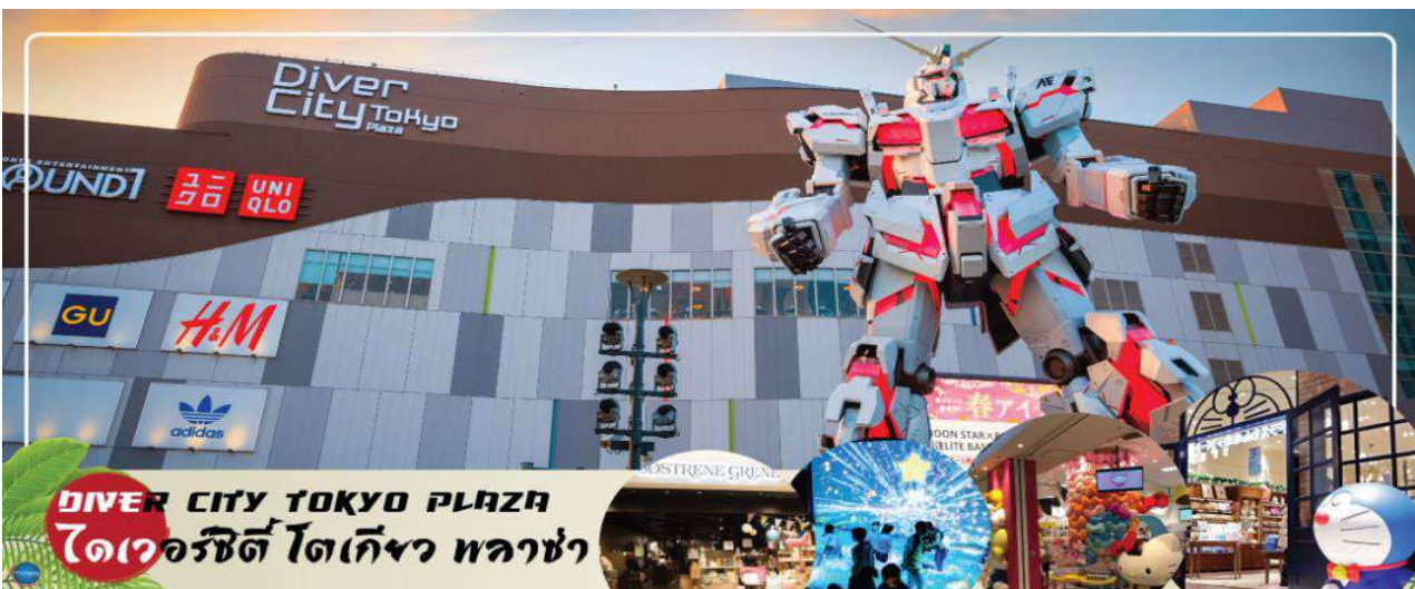
DIVER CITY TOKYO PLAZA ไดเวอร์ซิตี โตเกียว พลาซ่า

เดินทางสู่ ย่านโอไดบะ (Odaiba) เมืองคือเกาะที่สร้างขึ้นไว้เป็นแหล่งช้อปปิ้ง และแหล่งบันเทิงต่างๆ ในอ่าวโตเกียว ได้รับการปรับปรุงให้มีชื่อเสียงและเป็นที่ยอมรับในช่วงหลังของปี 1990 นอกจากนี้สถาปัตยกรรมที่สวยงามตั้งอยู่มากมายแล้ว แต่ก็ยังคงความเป็นธรรมชาติไว้ด้วยความอุดมสมบูรณ์ของพื้นที่สีเขียว ไดเวอร์ซิตี โตเกียว พลาซ่า (Diver City Tokyo Plaza) เป็นห้างดังอีกห้างหนึ่ง ที่อยู่บนเกาะ โอไดบะ จุดเด่นของห้างนี้ก็คือ หุ่นยนต์กันดั้ม ขนาดเท่าของจริง ซึ่งมีขนาดใหญ่มาก ในบริเวณห้าง อีสระช้อปปิ้งตามอัธยาศัย