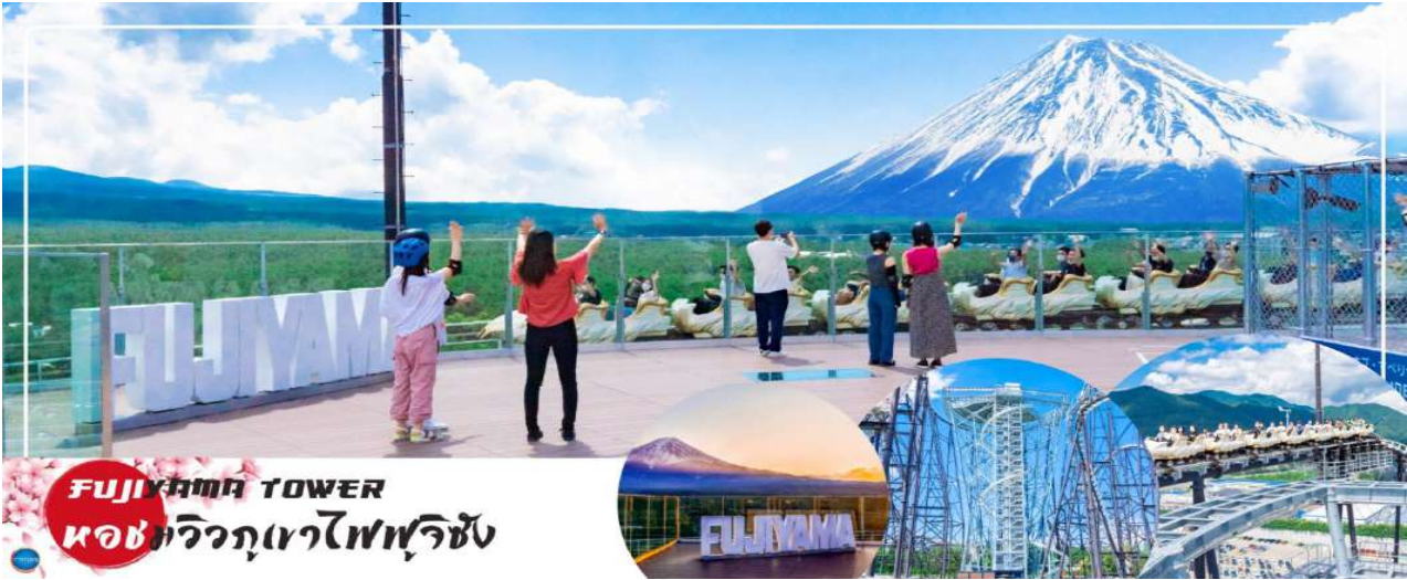
FUJIYAMA TOWER หอชมวิวภูเขาไฟฟูจิ

ได้เวลาอันสมควรนำท่านเดินทางสู่ เมืองนาริตะ (Narita) (ใช้เวลาเดินทางประมาณ 2.30 ชั่วโมง) นำท่านเดินทางสู่ อโชน มอลล์ นาริตะ (Aeon Narita Mall) ห้างสรรพสินค้าที่นิยมในหมู่นักท่องเที่ยวชาวต่างชาติ เนื่องจากตั้งอยู่ใกล้กับสนามบินนานาชาตินาริตะ ภายในตกแต่งในรูปแบบที่ทันสมัยสไตล์ญี่ปุ่น มีร้านค้าที่หลากหลายมากกว่า 150 ร้านจำหน่ายสินค้าแฟชั่น อาหารสดใหม่ และอุปกรณ์ภายในบ้าน นอกจากนี้ยังมีร้านเสื้อผ้าแฟชั่นมากมาย เช่น MUJI, 100 yen shop, Sanrio store, Capcom games arcade และซูปเปอร์มาร์เก็ตขนาดใหญ่