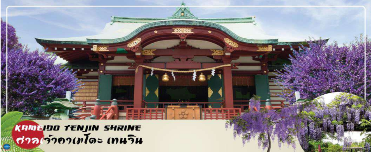
KAMEIDO TENJIN SHRINE ศาลเจ้าคามะโตะ เทนจิน

กรุงโตเกียว – ศาลเจ้าคามะโตะ เทนจิน (จุดชมดอกวิสทีเรียขึ้นอยู่กับสภาพอากาศ) – ย่านโอไดบะ – ห้างไดเวอร์ซิตี – ชมแมวยักษ์ 3 มิติ พร้อมช้อปปิ้ง ย่านชินจูกุ – เมืองนาริตะ