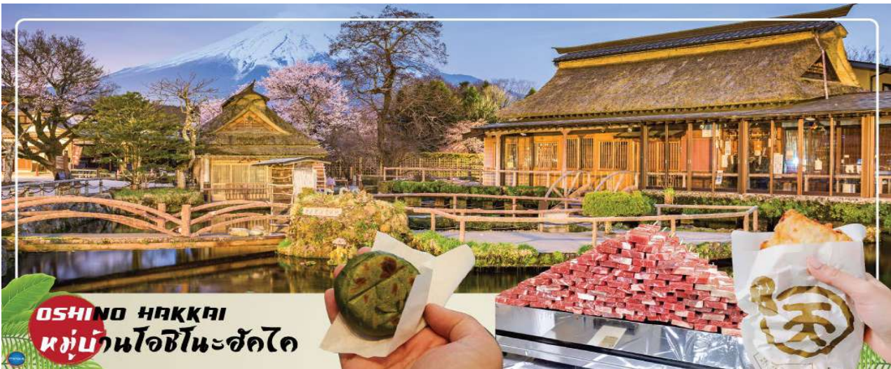
OSHINO HAKKAI หมู่บ้านโอชิโนะฮัคไค

ได้เวลาอันสมควรนำท่านเดินทางสู่ จังหวัดยามานาชิ (Yamanashi) (ใช้เวลาเดินทางประมาณ 2 ชั่วโมง) นำท่านเดินทางสู่ หมู่บ้านโอชิโนะฮัคไค (Oshino Hakkai) ให้ท่านเจาะลึกตามหาแหล่งบริสุทธิ์จากภูเขาไฟฟูจิ ที่เป็นแหล่งน้ำตามธรรมชาติตั้งอยู่ในหมู่บ้านโอชิโนะ จ.ยามานาชิ หรือพูดในทางกลับกันคือกลุ่มน้ำผุดโอชิโนะฮัคไค เพียงก้าวแรกที่ย่างเท้าเข้าไปในหมู่บ้านก็สัมผัสได้ถึงอากาศบริสุทธิ์ และไอเย็นจากแหล่งน้ำธรรมชาติที่มีให้เห็นอยู่ทุกมุม โดยในบ่อน้ำใสแจ๋วมีปลาหลากหลายพันธุ์แหวกว่ายอย่างสบายอารมณ์ แต่ขอบอกเลยว่าน้ำแต่ละบ่อนั้นเย็นจับใจจนแอบสงสัยว่าบ่อน้ำไม่หนาวสะท้านกันบ้างหรือ เพราะอุณหภูมิในน้ำเฉลี่ยอยู่ที่ 10-12 องศาเซลเซียสนอกจากชมแล้วก็ยังมีน้ำผุดจากธรรมชาติให้ดื่กดื่มตามอัธยาศัย และที่สำคัญ หมู่บ้านโอชิโนะยังเป็นแหล่งช้อปปิ้งสินค้าโอท็อปชั้นเยี่ยมอีกด้วย