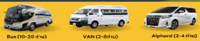
Bus (10-20 ท่าน) VAN (2-8ท่าน) Alphard (2-4 ท่าน)