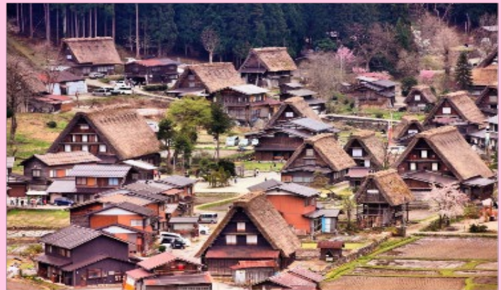
รูปใช้เพื่อประกอบการโฆษณาเท่านั้น