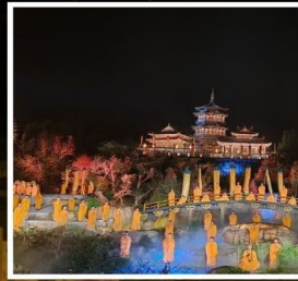
โชว์ SHAOLIN MUSIC CEREMONY