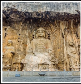
พระพุทธรูปแกะสลัก ศิหลงเหมิน