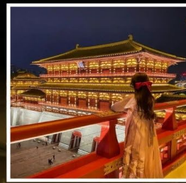
กำแพงอังกีเทียนเหมิน