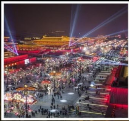
ถนนคนเดินวัฒนธรรมต้าถิง