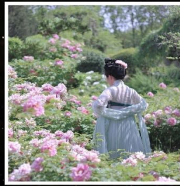
เทศกาลดอกโบตั๋น