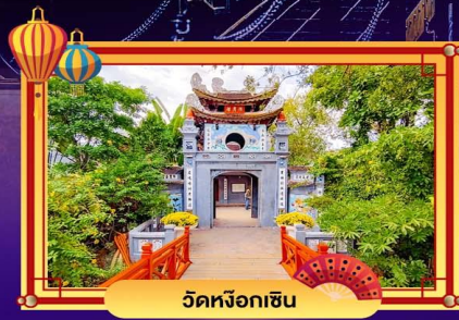
วัดหังอกเขิน