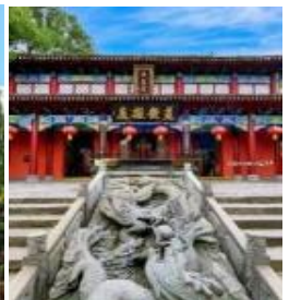
Tianshi Ancient Manor

คฤหาสน์เทียนซือ ตั้งอยู่ในภูเขาหลงหู เมืองช่างชิง มณฑลเจียงซี เป็นวัดบรรพบุรุษของสำนักเต๋ออันดับที่หนึ่ง(เจิ้งอี่) ซึ่งยังมีอีกหลายชื่อ อาทิเช่น ตำหนักปรมาจารย์ชื่อฮั่น หรือคฤหาสน์เจิ้งอี่เจิ้นเหริน (ตำหนักนักพรตเจิ้งอี่) สร้างขึ้นในปีที่สี่ของรัชสมัยฉงหนิงในราชวงศ์ซ่ง (ค.ศ. 1105) และเดิมตั้งอยู่เชิงเขาหลงหู หลังจากการเปลี่ยนแปลงและการปรับปรุงนับครั้งไม่ถ้วน ท้ายที่สุดคฤหาสน์เทียนซือก็กลายเป็นสถานที่ขนาดใหญ่และมีสถาปัตยกรรมที่งดงาม มีภูเขาซีหัวอยู่ทางทิศเหนือ เบื้องหน้าหันหน้าสู่แม่น้ำหลูซีและภูเขาฝีภา มีภูมิทัศน์โดดเด่นทั้งภูเขาสูง และสายน้ำพาดผ่าน เป็นจุดที่สว่างามเป็นเลิศด้านฮวงจุ้ย ครอบคลุม