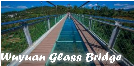
Wuyuan Glass Bridge

น่าชื่นชมแล้ว ใบไม้เปลี่ยนสีรอบพื้นที่ลาดเขา ก็ยังขับให้สีสันสลับลายโดดเด่นเป็นที่น่าหลงใหลอีกด้วย ซึ่งที่ขาดไม่ได้ที่ต้องพูดถึงก็คือความเก่าแก่โบราณของตัวเมือง ตึกรามบ้านช่องที่ยังคงสภาพความเป็นวัฒนธรรมสุขใจโบราณที่ยาวนานไว้ได้อย่างครบถ้วน เปรียบทั้งหมู่บ้านเป็นดังพิพิธภัณฑ์สถาปัตยกรรมสุขใจที่ยังมีชีวิตจนถึงปัจจุบัน ซึ่งตามบันทึกเก่าแก่ของเมืองอุ๋หยวนมีบันทึกไว้ว่า หมู่บ้านสร้างขึ้นและคงอยู่มาตั้งแต่สมัยราชวงศ์หมิงตอนกลางนับย้อนกลับไปได้กว่า 600 ปี