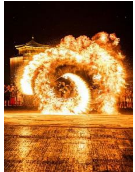
Melted Metal-Firework Show

นำท่านชม โชว์ดอกไม้ไฟเหล็กหลอม การแสดงทางวัฒนธรรมที่จับต้องไม่ได้ “ดอกไม้ไฟเหล็กหลอม” เป็นการจำลองพลุที่อยู่บนท้องฟ้ามาอยู่ในระดับสายตาให้เหล่าผู้ชมได้ยลโฉมความอลังการด้วยแสง สี และความสวยงามอันน่าทึ่งของ 1 ในวัฒนธรรมจีนที่สืบทอดกันมาในแถบพื้นที่ตอนใต้ของแม่น้ำเหลือง(ฮวงโห) การแสดงดอกไม้ไฟเหล็กหลอม เกิดขึ้นมายาวนานกว่าพันปีแล้ว โดยช่างตีเหล็กได้ค้นพบความงามหลุดจินตนาการนี้จากการทดลองโยนเหล็กหลอมสาดขึ้นสู่ท้องฟ้า ซึ่งหากมองจากไกลๆ จะดูเหมือนประกายไฟสีทองอันแสงงดงาม และยังเปรียบเหมือนกับดวงดาวที่ลอยเต็มฟ้า ซึ่งเป็นแนวความคิดที่คล้ายกับดอกไม้ไฟในปัจจุบันนั่นเอง และด้วยการพัฒนาไปไกลของยุคสมัย ทำให้สามารถจัดแสดงได้ด้วยความปลอดภัยไม่เป็นอันตรายอย่างแต่ก่อนที่ต้องอาศัยผู้เชี่ยวชาญถึงสามารถจัดการแสดงนี้ขึ้นได้ ดอกไม้ไฟเหล็กหลอมมักจัดแสดงขึ้นในเทศกาลตรุษจีน เพื่อเฉลิมฉลองการขึ้นปีใหม่ของจีนด้วยความยิ่งใหญ่ ตระการตาและยังถือเป็นการแสดงเพื่ออวยพรให้เกิดความเป็นสิริมงคลนั่นเอง (หากมีฝนตกจะไม่สามารถชมการแสดงได้)