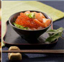
Toya Sun Palace Resort & Spa