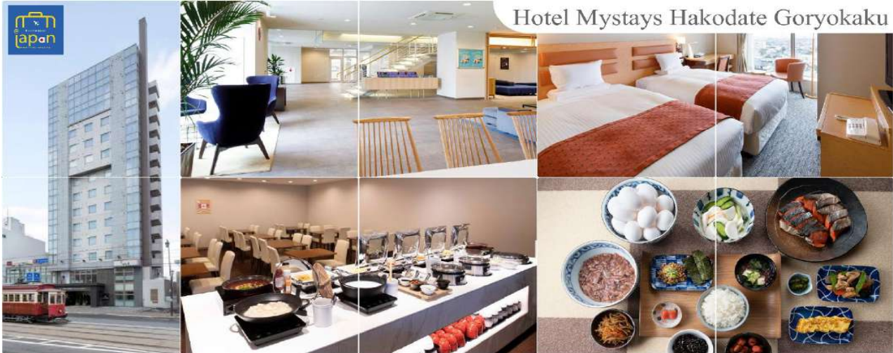
Hotel Mystays Hakodate Goryokaku

ที่พัก HOTEL MYSTAYS HAKODATE GORYOKAKU, HAKODATE หรือเทียบเท่าระดับเดียวกัน