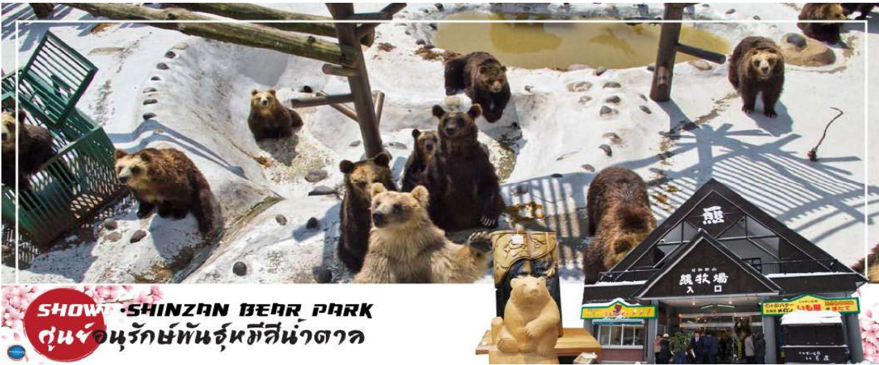
SHOWA SHINZAN BEAR PARK ศูนย์อนุรักษ์พันธุ์หมีสีน้ำตาล

วันที่สี่ ทะเลสาบโทยะ – ภูเขาไฟโชวะ (นั่งกระเช้า) – ศูนย์อนุรักษ์พันธุ์หมีสีน้ำตาล – สวนฟูกิดาชิ – เมืองซัปโปโร – ย่านซูซุกิโนะ