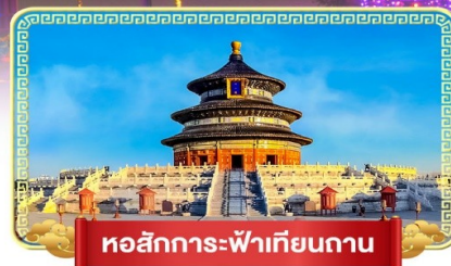
หอสังเกตการณ์ฟ้าเทียนถาน