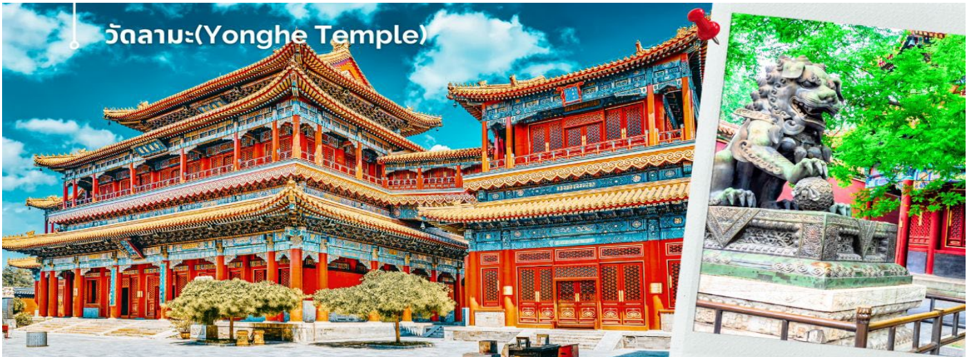
ผสมผสานวัฒนธรรมจีนและทิเบตได้อย่างลงตัว

เช้า นำท่านชม วัดลามะ(Yonghe Temple) หรือ วัดยงเหอ เป็นวัดพุทธแบบทิเบตที่ใหญ่ที่สุดแห่งหนึ่งในประเทศจีน มีประวัติศาสตร์อันยาวนาน ตั้งอยู่ใจกลางกรุงปักกิ่ง เนื้อที่กว่า 6 หมื่นตารางเมตร โดดเด่นด้วยสถาปัตยกรรมที่งดงาม วิจิตรบรรจง สร้างขึ้นในสมัยราชวงศ์ชิง เมื่อปี ค.ศ. 1744 เดิมทีเป็นพระราชวังขององค์ชายสี่ บางครั้งจึงเป็นที่รู้จักในชื่อว่า วัดองค์ชายสี่ ต่อมาได้ปรับเปลี่ยนเป็นวัดพุทธแบบทิเบต โดยได้รับอิทธิพลจากศาสนาพุทธนิกายเกลูกปา ซึ่งเป็นนิกายที่สำคัญในทิเบต ที่นี่ไม่เพียงแต่เป็นสถานที่สำคัญทางศาสนาเท่านั้น แต่ยังเป็นสัญลักษณ์ของการ