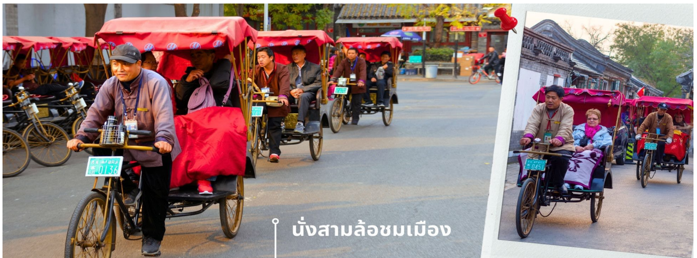
นั่งสามล้อชมเมือง

เป็น 1 ใน 8 จุดชมวิวที่มีชื่อเสียงของปักกิ่งมาตั้งแต่สมัยราชวงศ์จิน จากนั้นนำท่านแวะชมสินค้าร้านหมอนยางพารา เที่ยง 📍 รับประทานอาหารกลางวัน ณ ภัตตาคาร (4) พอสมควรแก่เวลานำท่านเดินทาง นั่งสามล้อชมเมืองโบราณหูท่ง สามล้อถือเป็นอีกหนึ่งขนส่งหลักของประเทศจีน การนั่งสามล้อเที่ยวชมเมืองเป็นที่นิยมของนักท่องเที่ยว เมืองหูท่งเต็มไปด้วยย่านที่อยู่อาศัยแบบดั้งเดิมของชาวปักกิ่ง