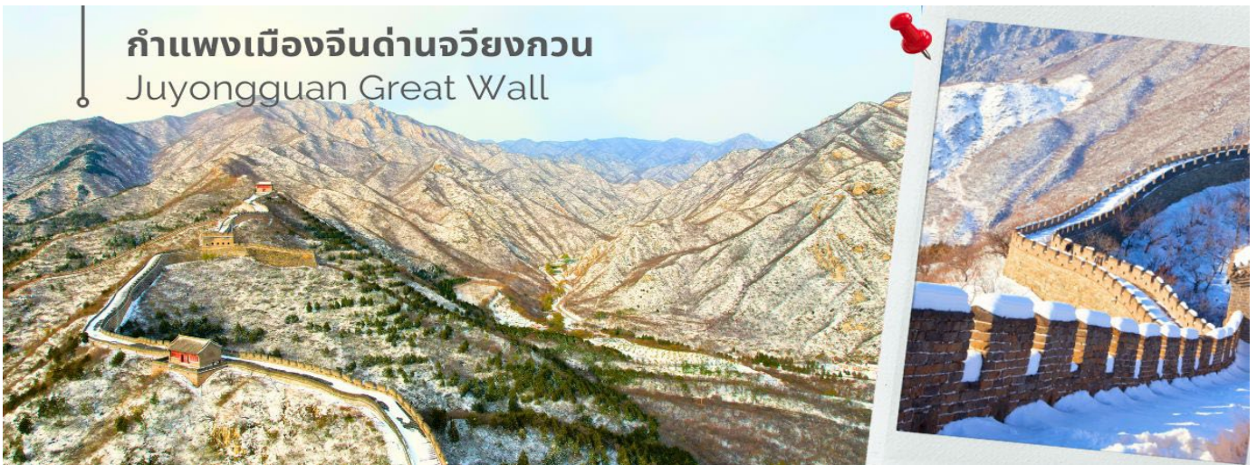
กำแพงเมืองจินด่านจวิยงกวน Juyongguan Great Wall

เช้า 📍 รับประทานอาหารเช้า ณ ห้องอาหารของโรงแรมที่พัก (3) แวะชมสินค้าร้านบัวหิมะ (ร้านรัฐบาลจีน) จากนั้นนำท่านเดินทางชมความยิ่งใหญ่ของ กำแพงเมืองจินด่านจวิยงกวน (Juyongguan Great Wall) หรือที่รู้จักกันในชื่อ ป้อมจวิยง เป็นด่านที่ใกล้กับใจกลางกรุงปักกิ่งมากที่สุด ราว 50 กิโลเมตร เท่านั้น นับเป็นหนึ่งในด่านสำคัญและเป็นสัญลักษณ์ของกำแพงเมืองจีน มีความยาวราว 4 กิโลเมตร ตั้งอยู่ทางทิศตะวันตกเฉียงเหนือของกรุงปักกิ่ง สร้างขึ้นในสมัย จินซีฮ่องเต้ กำแพงนี้ตั้งอยู่ในหุบเขา Guangou ทำให้มีชื่อได้เปรียบโดยธรรมชาติคือสามารถ "ยึดครองได้ง่าย แต่โจมตีได้ยาก" ถือว่าเป็นหนึ่งในจุดเริ่มต้นของกำแพงเมืองจีนในภาคเหนือ ซึ่งสร้างขึ้นเพื่อป้องกันกรุงปักกิ่งจากรุกรานจากชนเผ่าเร่ร่อน ด่านจวิยงกวนมีสถาปัตยกรรมที่สวยงามของศิลปะจีน จากยอดด่าน สามารถมองเห็นทิวทัศน์ที่สวยงามของเทือกเขาและธรรมชาติโดยรอบ นับว่า