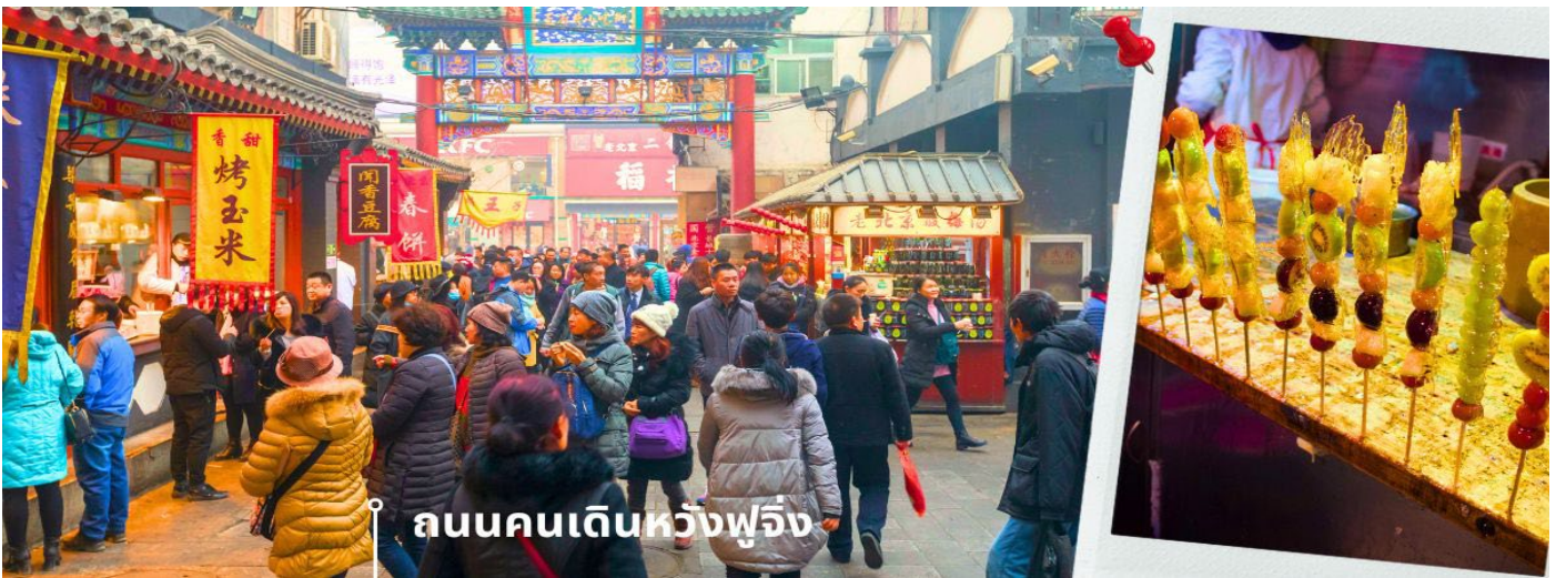
ถนนคนเดินหวังฝูจิ่ง

➡ นำท่านเข้าสู่ที่พัก Holiday inn Express หรือ Royard Hotel / หรือเทียบเท่า