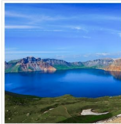
อุทยานดางไปซาน