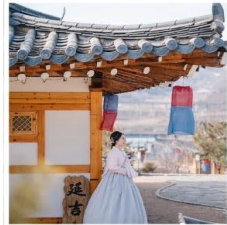
สวนวัฒนธรรม พื้นบ้านเกาหลี