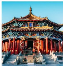
พระราชวังกุกัง