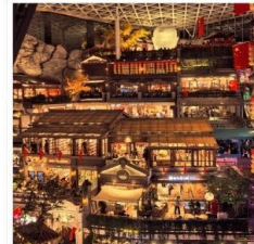
THE HILL CHANGCHUN