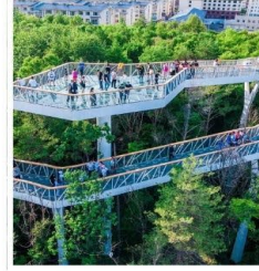
สวนต้นสน