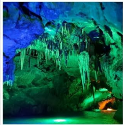
ถ้ำน้ำเป็นซี