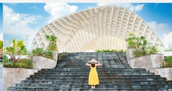
สวนเอเปค